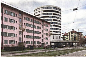
Menschen statt Autos: Das Schlotterbeck-Areal in Zürich wurde von einer Garage zu einer Wohnanlage umgenutzt, transformiert und verdichtet. Der neue Wohnturm wächst aus dem alten Rampengebäude heraus und verdankt ihm seine zylindrische Form.