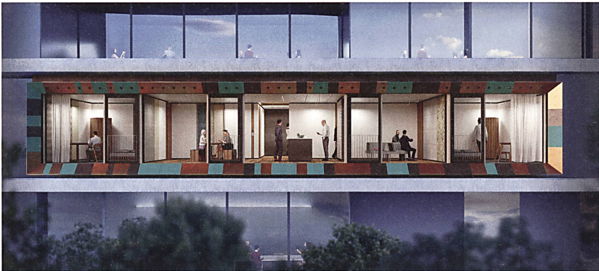
«Urban Mining and Recycling»: Rendering der Front des Forschungsmoduls mit rezyklierten Baustoffen am Empa NEST.

so miteinander verbunden werden können, dass sie allen bauphysikalischen Anforderungen entsprechen, aber dennoch sehr leicht sortenrein zurückgebaut werden können. Die eingesetzten Materialien stammen zu einem grossen Teil aus Recyclingprozessen; und sämtliche Bauteile können zu 100% in technische oder biologische Kreisläufe zurückgeführt werden.