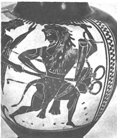
Pestalozzianum Zürich Archäologische Sammlung der Universität Zürich