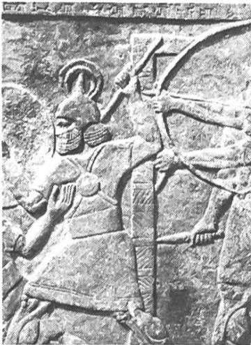
Pestalozzianum Zürich Archäologische Sammlung der Universität Zürich