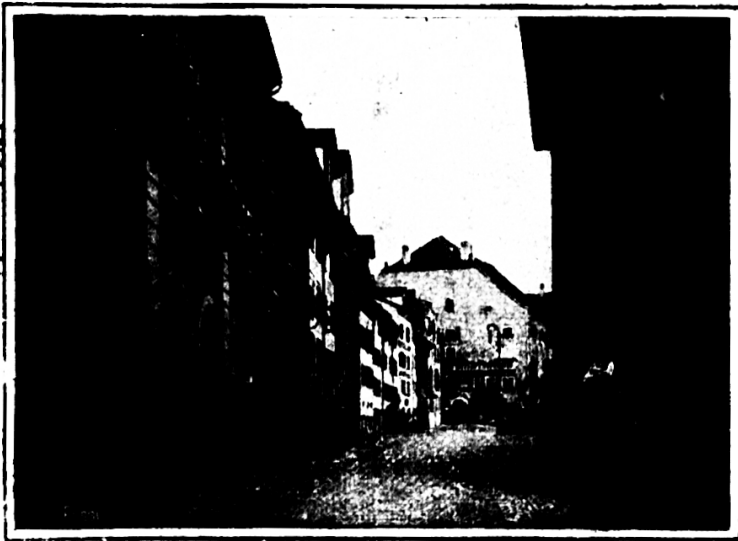
Hofplatz in Wil

Nach dem Zerfall des größeren Städtebundes blieb Wil von 1390 bis 1415 im sog. kleineren Städtebunde unter dem Schutze der Stadt Konstanz und wird in Urkunden jener Zeit als freie Reichsstadt aufge-