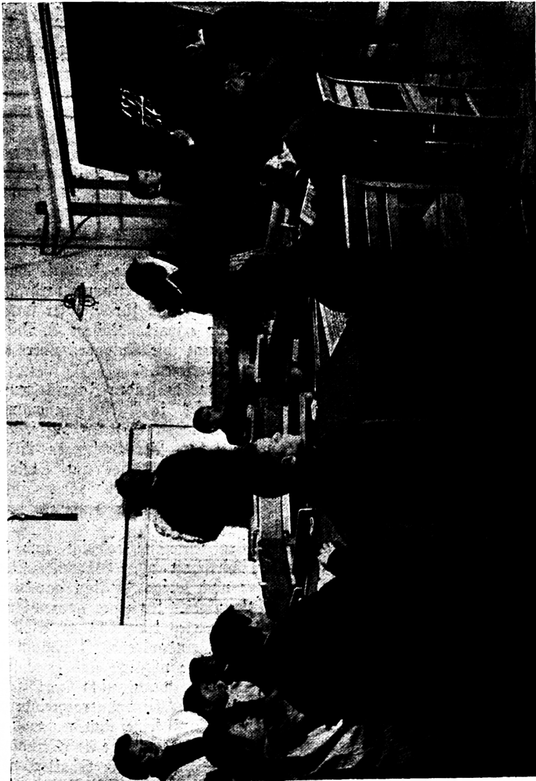
Sohanneum: Klasse der Schwerhörigen.