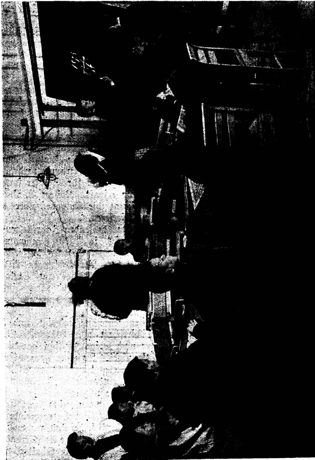
Sohanneum: Klasse der Schwerhörigen.