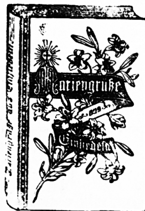
Bekleimerte Abwicklung der Einbanddecke.

Illustrierte Volks- schrift zur Pflege der Marienverehrung und des christlichen Lebens. Redaktion: hochw. Fr. J. E. Sa- gen in Frauenfeld. Abonnementpreis: Jährlich Fr. 2.50. — Probehefte zum Ver- teilen in der Schule erhalten Sie gratis vom Verlage Eberle & Rickenbach, in Einsiedeln.