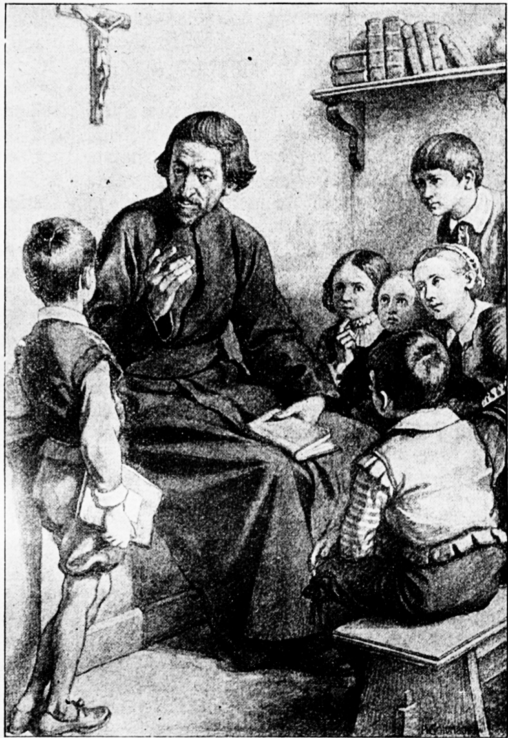
Petrus Canisius unterrichtet die Kinder.