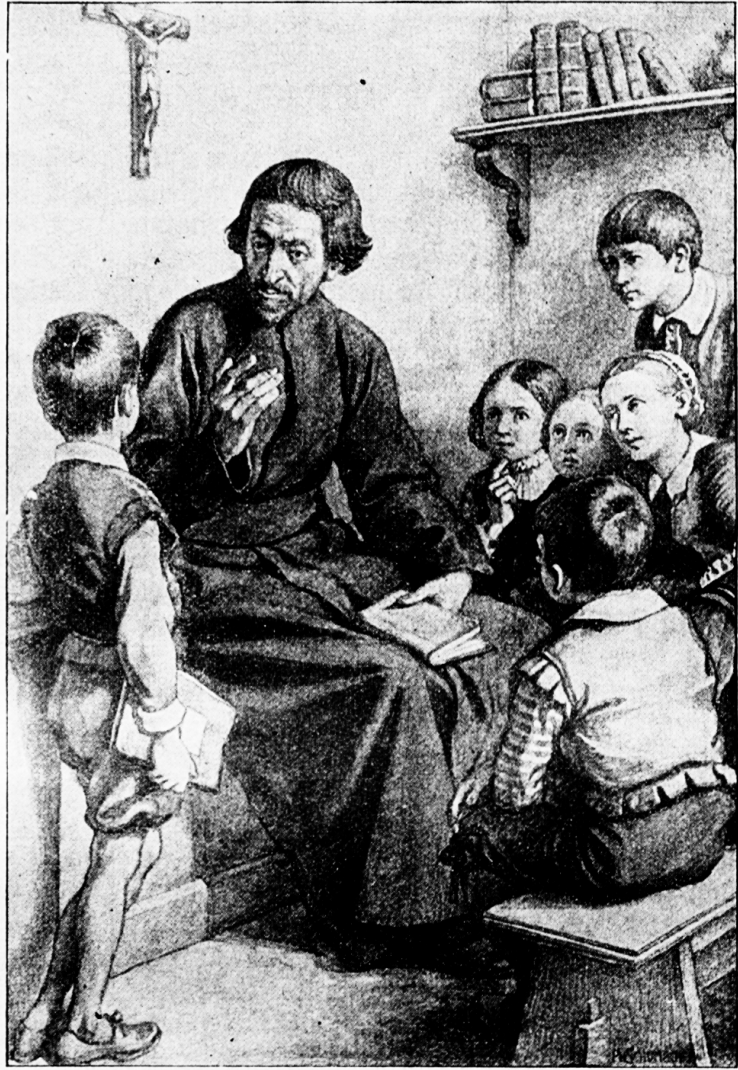
Petrus Canisius unterrichtet die Kinder.