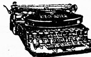
Diese tausendfach bewährte

Zu beziehen durch jede Buchhandlung oder direkt vom VERLAG OTTO WALTER A.-G. OLTEN UND KONSTANZ