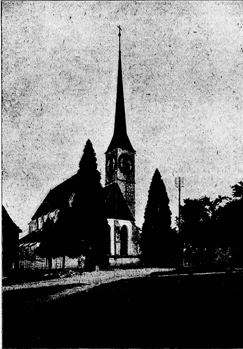
Zug: St. Oswald-Kirche.

Nochmals: wir bekennen uns, schon vom rein natürlichen Standpunkte aus, zu einem freudigen,