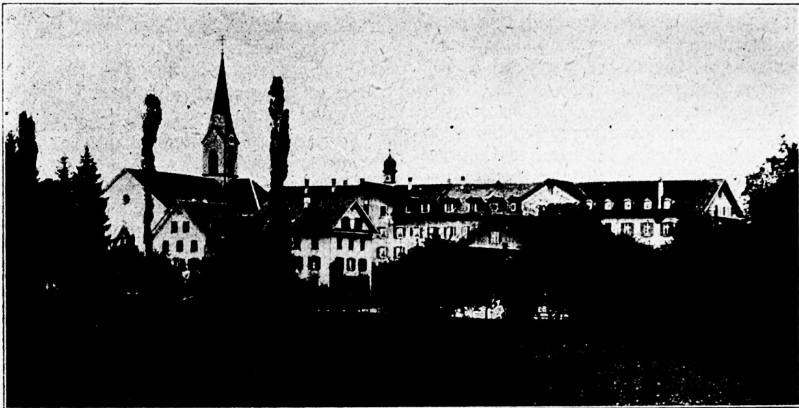
Institut „Heiligkreuz“, Cham.

Den Abschluß mögen einige statistische Zahlen über das zugerische Schulwesen im Jahr 1925/26 bilden. Darnach verzeichneten die zugerischen Primarschulen im letzten Schuljahr 3837, die Sekundarschulen 342, die Fortbildungsschulen 853, die Bürgerschulen 312, die Kantonsschule 96 Schüler. An den Primarschulen wirkten 103, an den Sekundarschulen 34 Lehrkräfte.