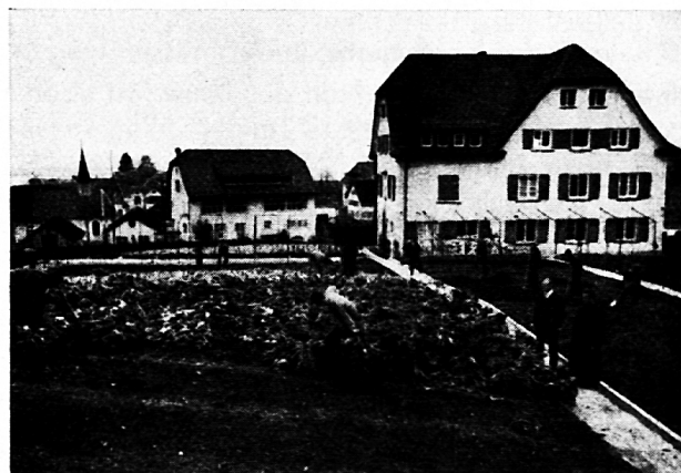
Landwirtschaftliche Schule Pfäffikon.

Doch darf es nicht an der Oberfläche bleiben, man darf nicht nur Rezepte für Saat und Fütterung geben, man muss das geheimnisvolle chemisch-biologische Ineinandergreifen der Lebensvorgänge aufdecken und den jungen