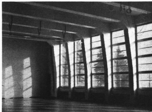
Halle in Eisenbetonkonstruktion.

Vibrationen der am wenigsten elastische Eisenbeton gewählt werden muss.