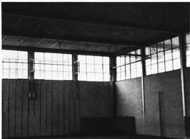
Halle in Eisenkonstruktion.