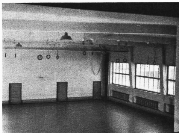
Vorteilhafte Disposition von Befensterung und Heizung.