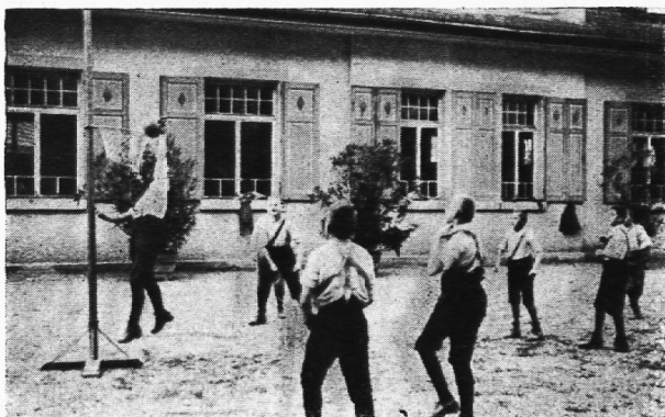
Taubstumme beim Korbball.

Der Laie ist gerne geneigt, sich den Taubstummen als Normalmenschen minus Gehör vorzustellen. Viele glauben sogar, ein gewandteres Auge ersetze dem Tauben zum Teil den Gehör-