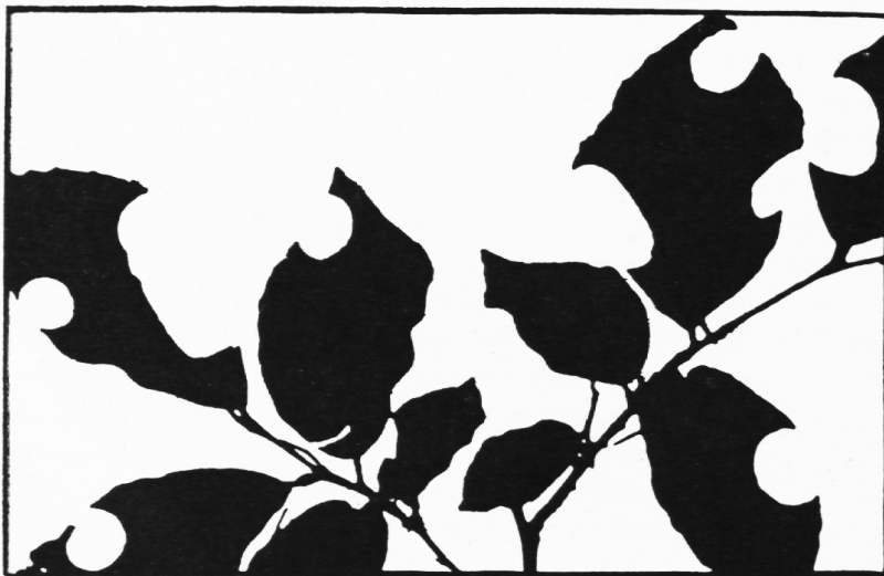
Abb. 2. Weissbuchenweig. Eine Blattschneiderbiene ( Megachile centuncularis ) hat aus den Blättern Stücke ausgeschnitten. (Schattenschnitt.)

Aber da ist schon wieder etwas Neues zu sehen: Das Gestrampel am Boden mag wohl einem Regenwurm unbehaglich geworden sein. Er kommt aus seinem Loch hervor. Ein Schüler fasst ihn an, hebt ihn hoch. Der Wurm schlägt wie besessen um sich und im gleichen Augenblick hat der Junge zwei Stücke des Regenwurms in der flachen Hand. Das Tier ist von dem plötzlichen