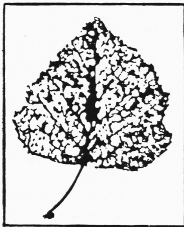
Abb. 3. Birkenblatt mit Fraßspuren des Junikäfers.

An einem Birkenbäumchen ist kein Blatt mehr heil. Junikäfer gibt es in Menge. Sie sitzen auf den Blättern, lassen sich aber bei Berührung sofort schwer zu Boden fallen. Das Laub sieht infolge der zahlreichen Löcher wie durchsiebt aus. Ein Schüler, der gerne Naturdrucke herstellt, hat