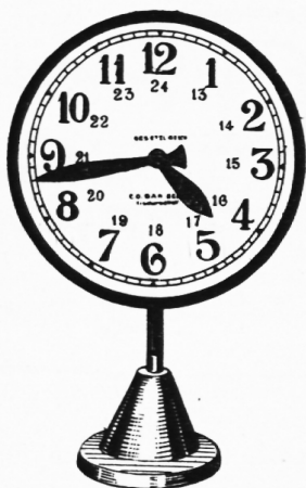
*) E. Ingold, Herzogenbuchsee. Preis 12.50 Fr.

Im Rechnen, bei der Behandlung der Zeiteinteilung, im Fremdsprachenunterricht, überall