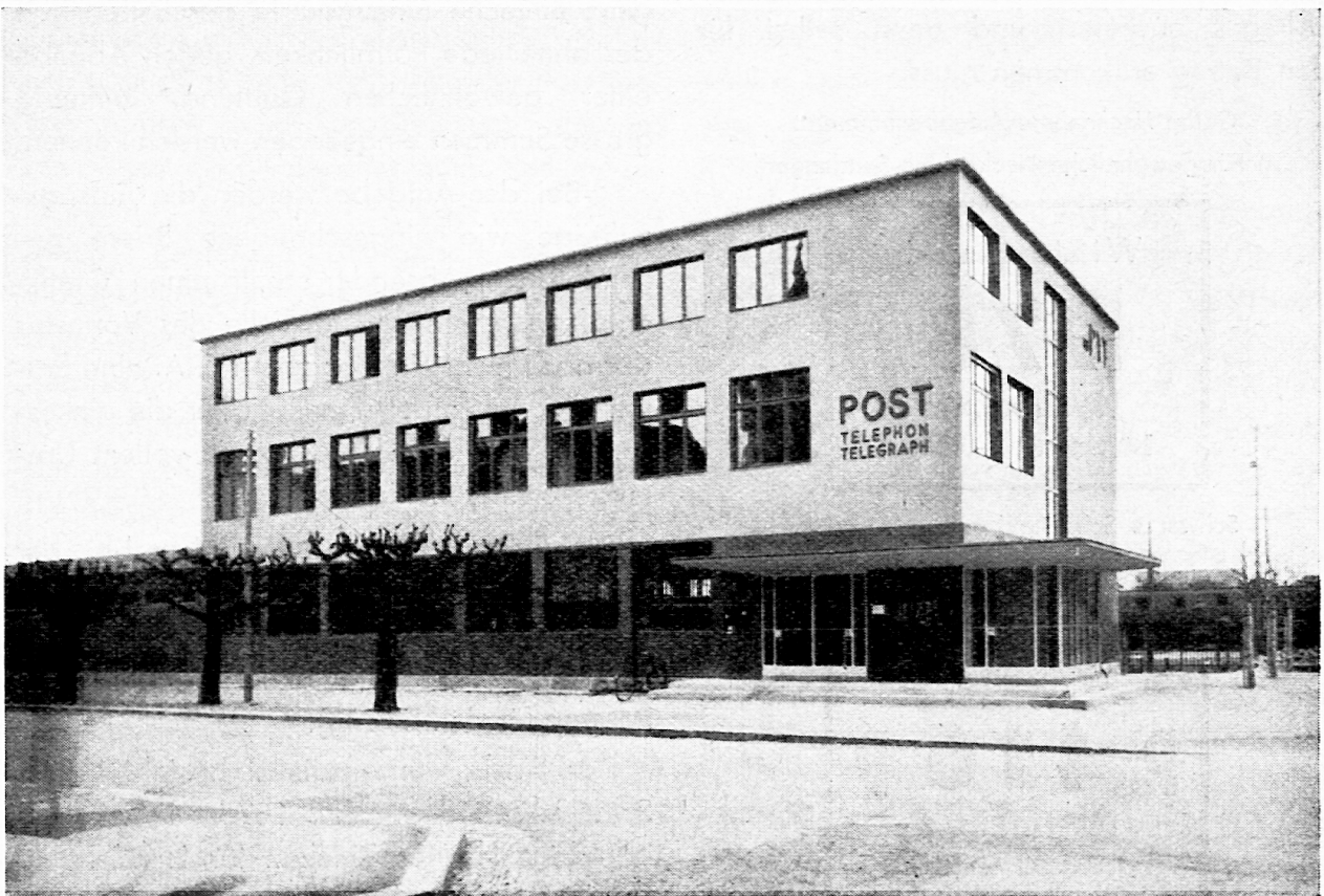
Eidg. Post-, Telegraphen- und Telephonegebäude in Rapperswil (St. Gallen) (neuer, moderner Zweckbau).

Die Nachnahmen verursachen der Post eine ziemlich grosse Mehrarbeit. Die Auf-