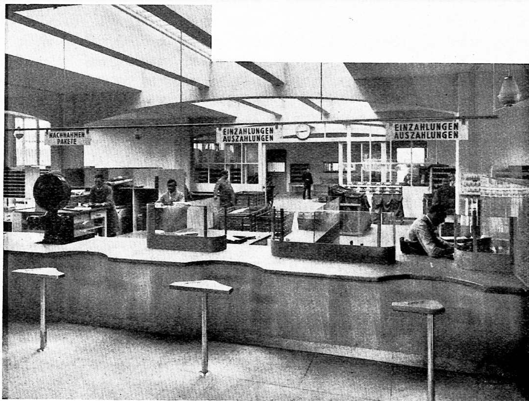
Postamt Baden. Schalteranlage, Aussenansicht.

Worin besteht der Postcheckdienst? Auf schriftliches Gesuch, das bei jeder Poststelle eingereicht werden kann, eröffnet die Postverwaltung jeder erwachsenen, handlungsfähigen Person eine sogenannte Postcheckrechnung bei einem der 25 schweizerischen Postcheckämter. Auf diese Checkrechnung können von jeder beliebigen Person mit den vorhin genannten grünen Einzahlungsscheinen Einzahlungen gemacht werden. Die Postverwaltung verbucht die Zahlungen zugunsten des auf dem Einzahlungsschein angegebenen Kontoinhabers. Dieser kann jederzeit mit einem Postcheck über sein Kontoguthaben verfügen, mit Ausnahme eines Betrages von 50 Franken (Stammeinlage), der immer auf dem Konto bleiben muss und der erst zurückbezahlt wird, wenn man die Checkrechnung aufhebt. Auf einer Checkrechnung können sich aus 100 oder 1000 kleinen Kanälen grosse Guthaben sam-