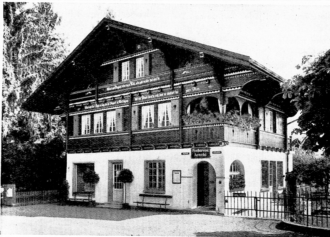
Sehr schönes Landpostbüro (Aeschi bei Spiez).

derung, sondern er erteilt ihr auch den Auftrag, die Sendung erst dann dem Empfänger auszuliefern, wenn dieser den auf der Sendung vorgemerkten Nachnahmebetrag bezahlt. Es handelt sich also hier um ein Geschäft „Zug um Zug“, entweder Bezahlung des Nachnahmebetrages und Empfang der Sendung, oder Zahlungsverweigerung und Rückgabe der Nachnahme an den Absender. Des Aufgebers Rechte werden beim Nachnahmedienst weitgehend gewahrt; hier ist der Bezug einer Ware ohne gleichzeitige Bezahlung (Kreditieren) ausgeschlossen. Darin liegt nicht bloss ein Vorzug, sondern auch eine Schwäche, denn viele Personen betrachten es als Zeichen des Misstrauens, wenn ihnen eine Sendung unter Nachnahme zugesandt wird. Diesem Vorurteil sollte begegnet werden, denn die Nachnahmen verdienen es nicht. Sie bilden nach wie vor das einfachste Mittel, Warenlieferung und Bezahlung in einem Zuge zu erledigen.