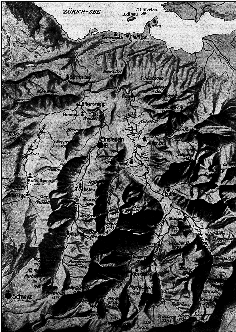
Karte über die Lage des Bezirkes Einsiedeln

geändert. Die Elektrizität wurde entdeckt. Und, nachdem man an verschiedenen andern Orten im Schweizerlande herum Kraft-