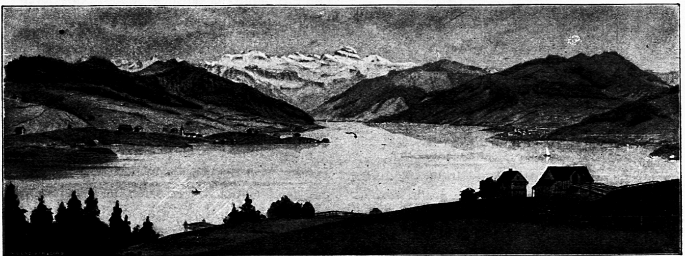
Wie der Stausee aussehen wird

den und am 10. Oktober 1910 unbenutzt abliefen und erloschen. Um 1900 herum wurde der Schöpfer des generellen Projektes mit der Ausarbeitung eines Bauprojektes beauftragt. Zwei Jahre später interessierte sich der Kanton Zürich als solcher sehr um die Ausführung des Werkes. Geologische, technische, wirtschaftliche und Rentabilitätsgutachten wurden eingeholt, die durchwegs gut lauteten. Die angebahnten Unterhandlungen mit dem Kanton Schwyz, vorab mit den Bezirken, die durch das Etzelwerk stark in Mitleidenschaft gezogen würden, verliefen vorläufig ergebnislos. Als der Kanton Zürich schon daran dachte, auf die Ausführung des Etzelwerkes zu verzichten, übernahmen die Schweizerischen Bundesbahnen von der Maschinenfabrik Oerlikon das Bauprojekt und die verschiedenen damit zusammenhängenden Arbeiten. Am 24. September 1910 gelangten sie mit dem Gesuch um Verleihung der Werkkonzession an die Kantone Schwyz, Zürich und Zug. Nach vielen Unterhandlungen der Kantone unter sich, wie der beiden Bezirke Einsiedeln und Höfe, einigte man sich am 3. Juli 1919 zum heute noch geltenden Verträge. Er wurde von allen Kontrahenten mit Ausnahme des Kantons Schwyz genehmigt. Mit diesem wurden im November 1926 eigene Zusatzverträge abgeschlossen, die durch die neuen Lebensverhältnisse der Sihl-