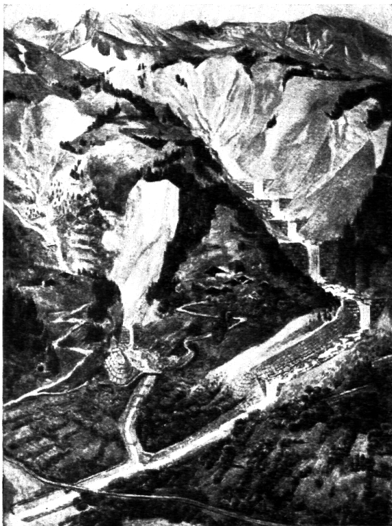
Schweiz. Schulwandbilderwerk: Nr. 20: Viktor Surbeck: Wildbachverbauung.

Reinhold Kündigs Bauernhof spricht nicht nur das ostschweizerische Milieu im Aeusseren aus, sein ganzes Wesen geht in der Malerei dieses heimatlichen Gedichtes von Hühnern, Hund und Katze, von Vieh und Stall auf, während Viktor Surbeck uns den Berner Bauernhof in der Gotthelf'schen Erdschwere zeigt, wo Wiese und Hügel das mächtige Bauernhaus umhegen und betreuen. Der aus vielfältigen Plakaten bestens