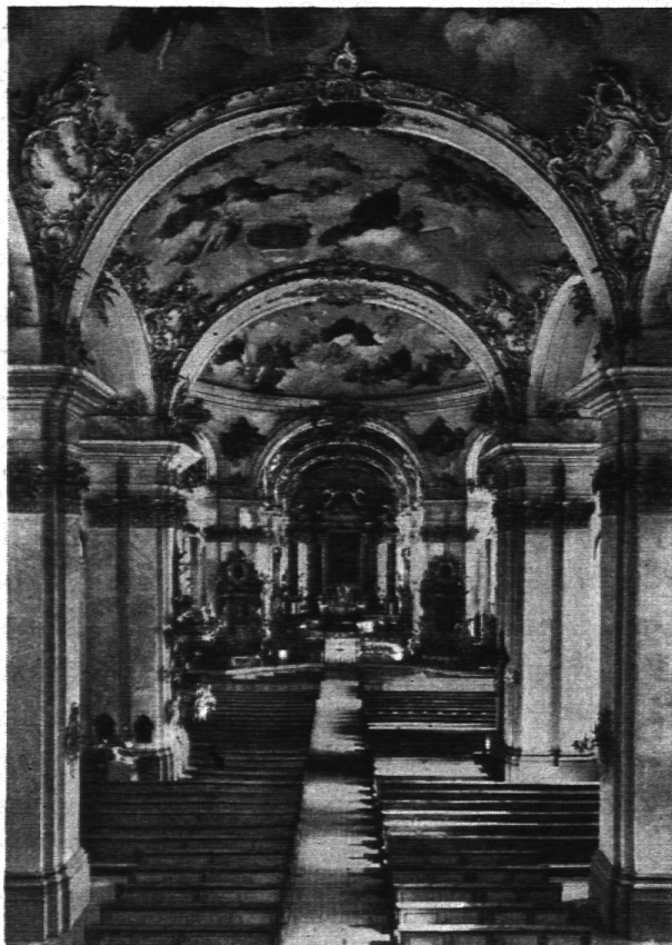
Das Innere der St. Galler Kathedrale.

schlichten Höhenlinien der Flügel prangt sie in fast verschwenderischem Reichtum vor dem verblüfften Auge.