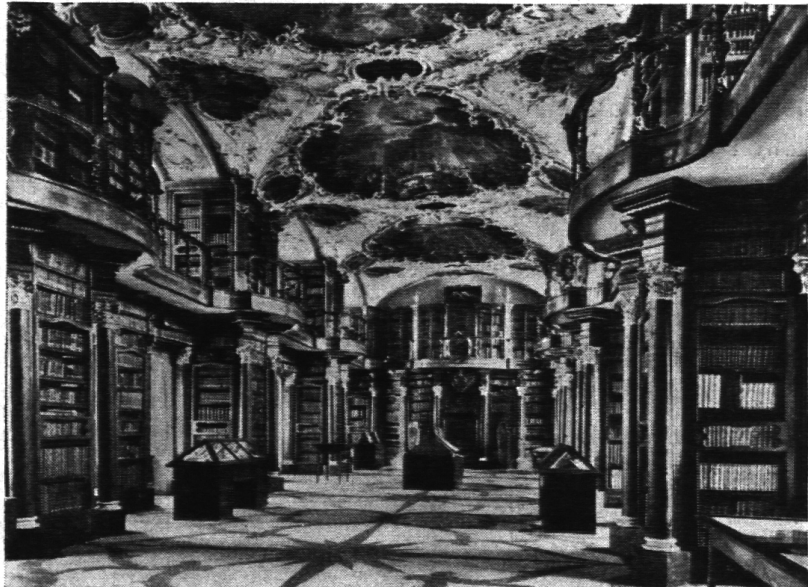
Die Stiftsbibliothek in St. Gallen. Erbaut von Peter Thumb aus Kon- stanz (1681—1766).

Hoch über uns wölbt sich der blaue Himmel des mächtigen Kuppelgemäldes, auf dem gegen hundertfünfzig Heilige und Engel die Freuden der „Acht Seligkeiten“ darstellen. Bald wie in Verzückung gebannt, bald in Verklärung gelöst und entrückt, schweben sie über die seligen Höhen dahin. Zuversichtlich fromme Freude strömt von ihnen herab auf den kleinen Menschen, der hoffend und ahnend zu ihnen emporblickt. Fühlt er sich nicht mit einem Male wie aus der Enge seines erdgebundenen Daseins enthoben und der Gemeinschaft der Seligen nahegerückt? — Eines ist gewiss! Dies ist keine Stätte, um in dumpfer Ergebung Gebete zu murmeln und bohrenden Gedanken über sein Seelenheil nachzuhängen, wie etwa im mystischen Dunkel einer romanischen Kirche, noch, wie im steilen Höhenflug eines gotischen Domes, den Anschluss an Gott gleichsam zu ertrotzen. — Hier ist er da! Alle Probleme der Erdschwere scheinen hier gelöst, der Blick in den Himmel offen, die Sehnsucht des Frommen gestillt.