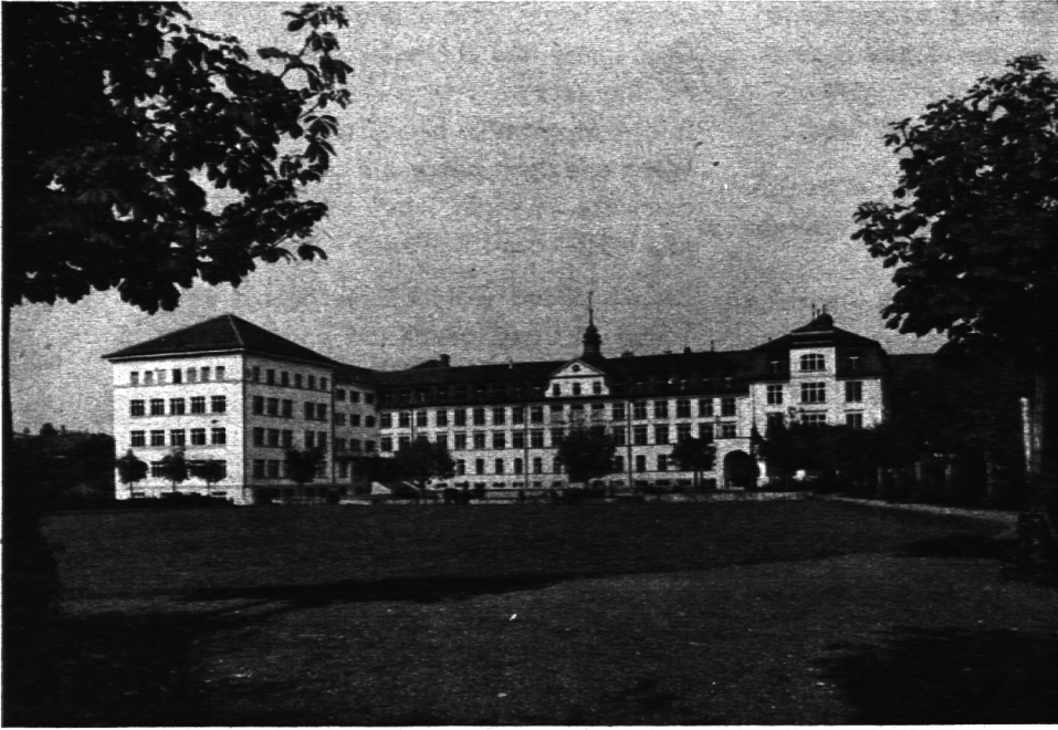
Kollegium St. Antonius, Appenzell.

Erst 1855 wurde die Schule in der Form eines „Realgymnasiums“ wieder ins Leben gerufen; ihr Lehrstoff wies nur Realfächer auf. Sie hatte keinen langen Bestand. 1871 sah durch private Initiative die Eröffnung einer gemischten Realschule. Zehn Jahre später wurde damit auf kurze Zeit wieder eine Lateinschule verbunden. — 1887 ging diese private Schule an den Staat über. 1894 teilte sich die gemischte Realschule in eine Knabenrealschule und in eine private Mädchenrealschule. Die Knabenrealschule ging 1908 mit der eigentlichen Gründung des Kollegiums St. Antonius ein.