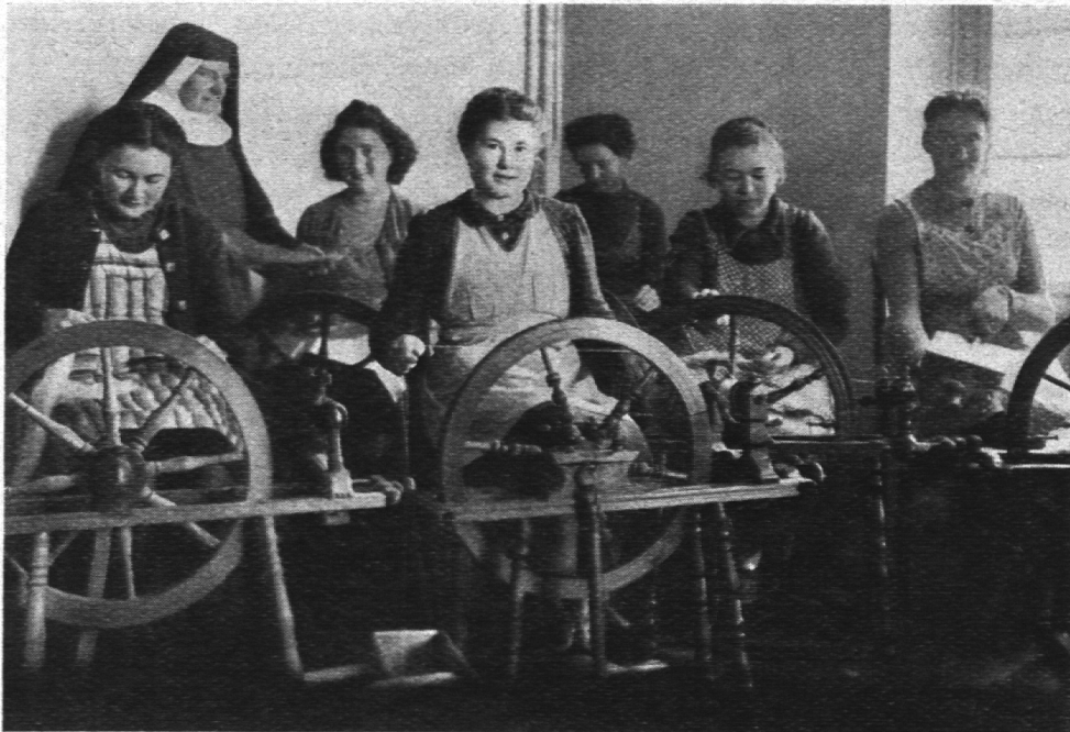
Bäuerinnenschule Illanz: Spinnerei.

feln marschbereit. Gruppe Ia und b wandert zur Küche. Dort empfängt sie mit vertrautem Gruss „Guete Morge“, „Bien di“, die Schwester Küchenmeisterin. Nach kurzer Besprechung des heutigen Speisezettels, nach Zusammenstellung und Nährwert, beginnt ein frischfrohes Zurüsten des einfachen, der Kriegszeit angepassten Mahles von Heimatkost, das dann am Mittag von der ganzen hungrigen Schar mit gewaltigem Appetit verzehrt wird. — Vor freudiger Erwartung zappelnd steht eine Gruppe vom II. Kurs bereit, auf den höhergelegenen, schönen Albertushof hinaufzusteigen zur Haus-Metzgete. Das ist allemal ein wahres Fest, wenn sie droben selber schlachten und dann die kräftigen, wohlschmeckenden Hausmacher Blut- und Leberwürste, Fleischkäse etc., selbst herstellen dürfen. Die schmecken dann am Mittag und Sonntagabend doppelt gut, weil Eigenfabrikat!