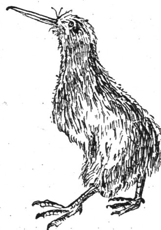
Fig. 2. Kiwi, Australischer Schnepfenstrauß; Flügel fehlen, Federn haarförmig.

Die Abweichungen der Umrisslinien von der streng zu fordernden „besten Form“ des Vogels bewirken sofort eine Störung und damit Verlust der Freiheit im Luftraum. Es ist so, als ob der Bodenvogel das Leben anderer Typen nachahmen wollte und seinem Ideal untreu geworden wäre. Er verwendet die nun frei werdende Gestaltungskraft des Typus für die neu auftretenden Schmuckfedern. Wie werden die Kinder im Unterrichtsgespräch ihre oft nicht geringen Kenntnisse vom Pfau, der sein Rad schlägt, aber kaum mehr fliegen kann, vom Fasan, der silbern oder golden die lange Schleppe trägt, aber bei einer Ueberschwemmung im Auwald sogar ertrinken kann, herbeitragen, um den Gedanken auszubauen! Der Vogel, der nicht mehr Vogel im eigentlichen Sinne des Wortes ist, geht maskiert, verdeckt seine Unfähigkeit, schmückt sich mit Federn, die über den jämmerlichen Zustand seines Flugapparates hinwegtäuschen sollen. Dies gilt ja vor allem für die männlichen Vögel, die mit solchen Prunk-