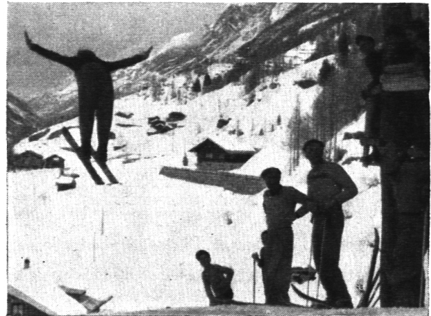
Ein vollendeter Sprung eines Achtklässlers.

Trotz schwierigen finanziellen Verhältnissen ist es die erste Aufgabe, in jeder Gemeinde einen Turnplatz zu schaffen. Für alle Lehrer, die das Amt eines Gemeindepräsidenten innehaben, sollte es eine Selbstverständlichkeit sein, dass sie mit dem