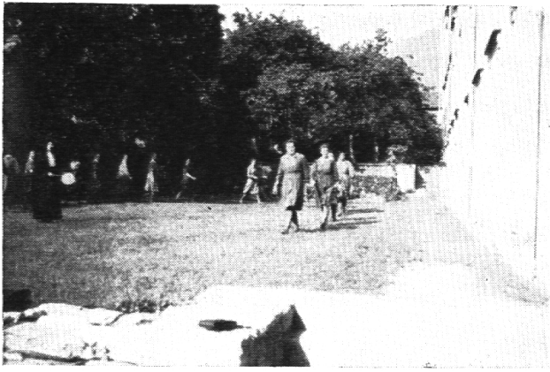
Mädchennormalschule in Brig.