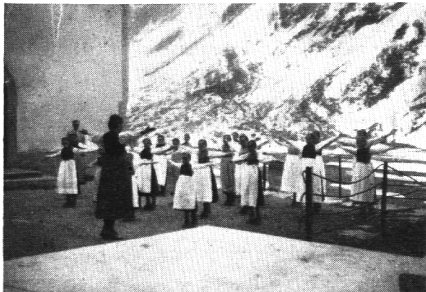
Die kleinen Lötschentalerinnen beim Durcharbeiten einer Freiübung.

gen Verhältnissen haben die Mitglieder des Lehrerturnvereins die ersten Steine zum Aufbau gelegt. Zahlreiche, gut besuchte Turnkurse schufen die Möglichkeit, eine obligatorische Turnstunde für Knaben durchzuführen. Gleichzeitig wurde eine Parallelentwicklung des Mädchenturnens angestrebt, was leider misslang. Der Hauptgrund war die Nichtaufnahme des Mädchenturnens in den Lehrplan. Erst später wurde durch spezielle Verfügung die obligatorische Turnstunde für Mädchen eingeführt. Die ersten Impulse zur Förderung des Mädchenturnens gingen vom Schweizerischen Turnlehrerverein aus, indem er Kurse für Lehrerinnen organisierte. Später wurde ein Einführungskurs für Lehrschwestern im Institut St. Ursula unter der Leitung von Hrn. Anton Kuster durchgeführt. Von da aus gingen auch alle Anregungen für die Weiterentwicklung dank dem unermüdlichen Wirken