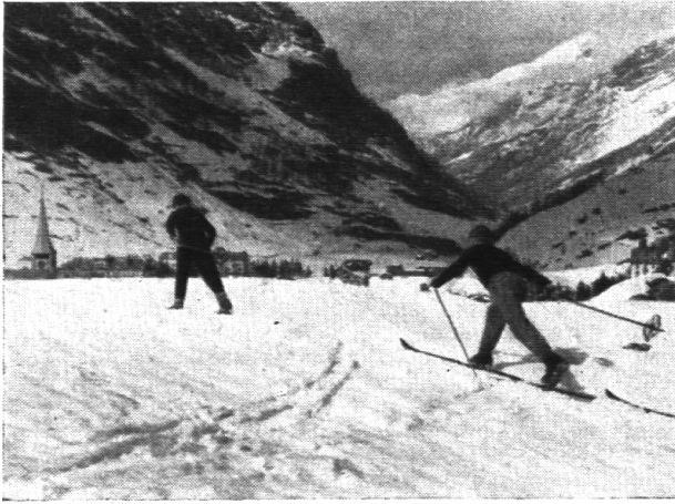
Laufschule in Zermatt.