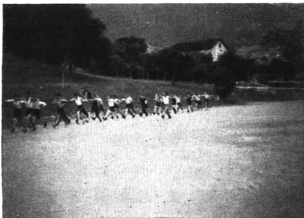
Laufschule im Kollegium von Brig.

Turnhallen, Plätze und Geräte: Im Oberwallis bestehen sechs mit Geräten versehene Turnhallen, die Turnplätze erreichen diese Zahl nicht. Rund zwei Drittel aller Schulgemeinden verfügen weder über Geräte noch über einen Turnplatz. Demzufolge ist die Klage des Lehrpersonals durchaus zu begreifen. In mehreren Schulgemeinden beginnt man ein lebhaftes Interesse an der Schaffung von Turnplätzen zu zeigen und hat bereits begonnen, Plätze zu schaffen. An dieser Stelle sei ein Beispiel hervorgehoben: Das schöne Städtchen Brig verfügt über keinen Sportplatz. Hier