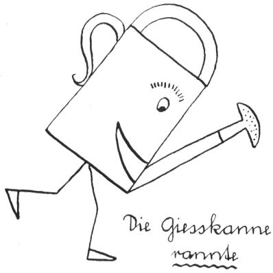
Die Gieskanne rannte