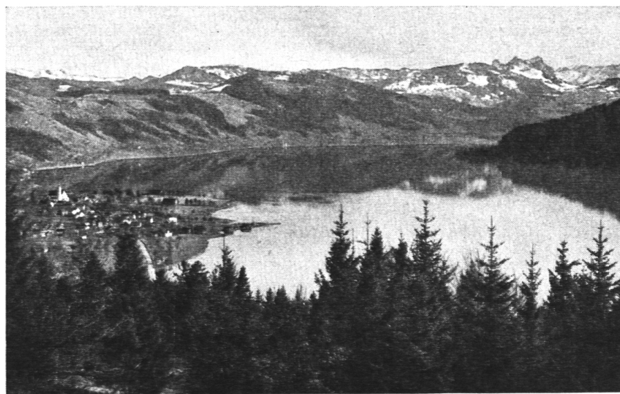
Blick auf Oberägeri, Ägeri-see und Alpen (Eberhard Kalt-Zehnder, Zug)

lichen Zugerrötel, nach altem Rezept vortrefflich zubereitet.