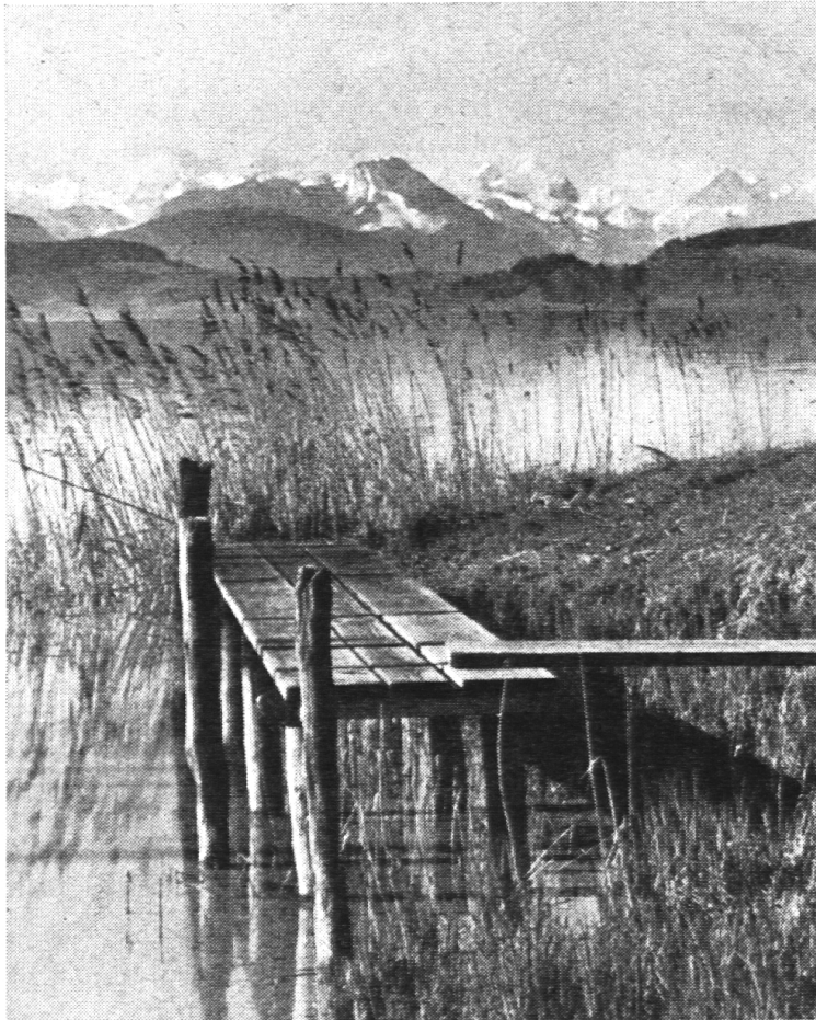
Blick über den Zugersee gegen Stanserhorn und Berner Alpen

Dem Getreidebau nicht förderlich sind oft die starken Niederschläge im Juni, Juli und August, dafür sind die Voraussetzun-