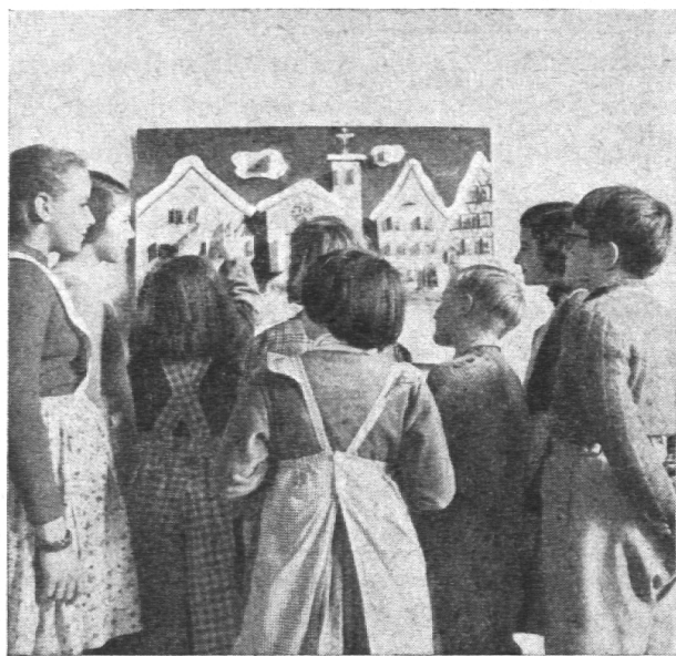
Abb. 2 Ein Türchen am Adventskalender der Klasse wird aufgemacht.

Schneemann drin eine brennende Kerze, in einem Vogel eine Brezel usw. Es gibt auch Stadt- und Dorfbilder, bei denen man wohl Fensterchen aufmachen kann, aber hinter denen einfach Gegenstände, die das Kind sich unter Umständen auch noch wünschen könnte, zum Vorschein kommen. Diese Kalender haben wohl den Zweck, einen Katalog der wünschbaren Dinge auf