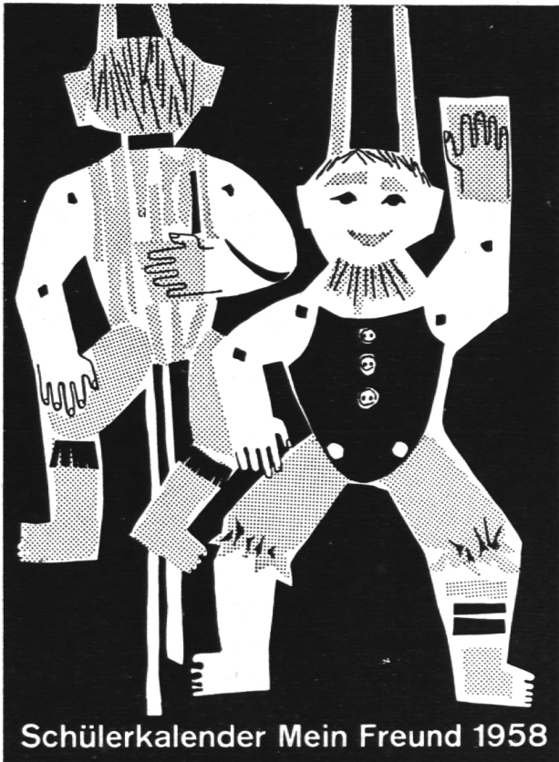
Schülerkalender Mein Freund 1958

Der unentbehrliche Freund der Jugend wird alle Schülerherzen begeistern. Über 250 Bilder. Eine köstliche Fundgrube für Buben und Mädchen! Das willkommene Weihnachtsgeschenk. Preis nur Fr. 4.30. In Buchhandlungen und Papeterien zu beziehen. Walter-Verlag Olten