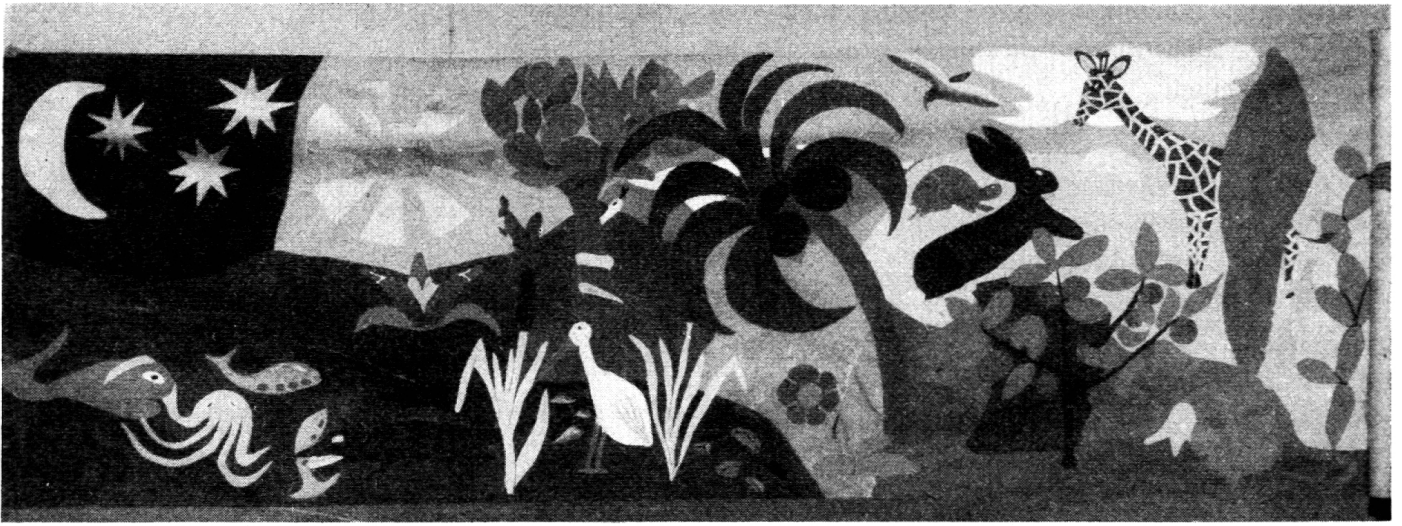
Gemeinschaftsarbeit zweier Knaben