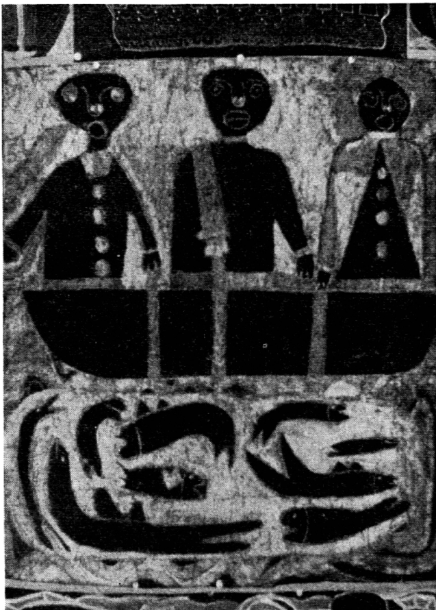
Der reiche Fischfang.

bar. Das Schöne hat Ausdruck gefunden und verzaubert alle Wände des Raumes mit Bildern, die das Geistige weihvoll ausstrahlen.»