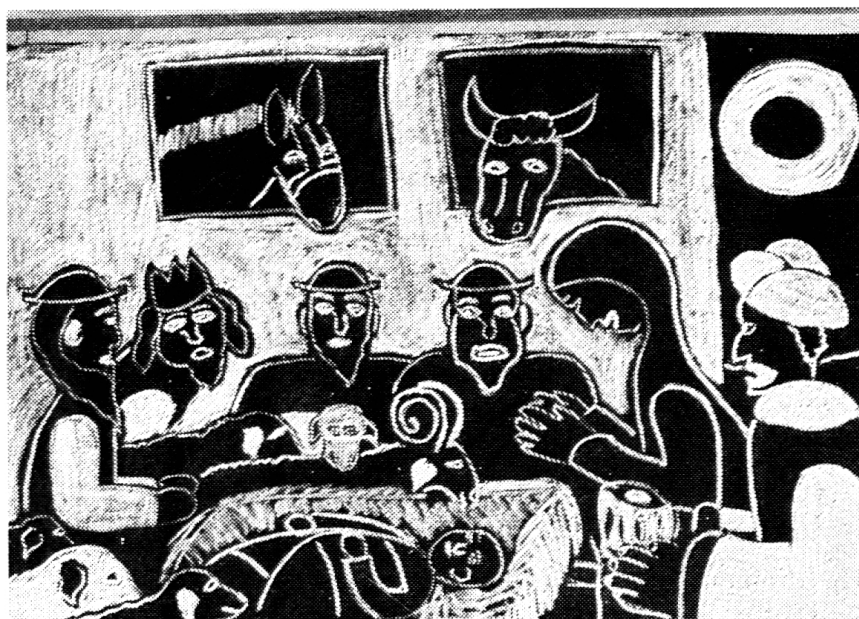
«Die Geburt Jesu». Dieses Thema spricht die Seele an. Zu beachten ist die Schwarzweiß-Verteilung. Eine graphisch vollendete Gestaltung.

Stieger aber gibt uns keine Rezepte. Es geht ihm um eine Grundhaltung. Wer diese versteht, weiß wie vorgehen. Die Grundhaltung zu formulieren aber überlassen wir ihm. Er sagte in einem Vortrag an der Pädagogischen Hochschule zu Coburg: «Das Herz der Kinder denkt tiefer als der Verstand der Erwachsenen. Die Gegensätzlichkeit zur intellektuellen und technischen Elementarerziehung kommt vielleicht nirgends so klar zum Bewußtsein wie in der Bibelstelle: Wenn ihr nicht werdet wie die Kinder, so werdet ihr nicht ins Himmelreich eingehen. So demütig sind wir Erwachsenen nicht. Wir sagen eher: Wenn ihr nicht werdet wie Erwachsene, so werdet ihr nicht glücklich werden in eurem Leben. – Wie Schriftgelehrte und Pharisäer versuchen wir bestän-