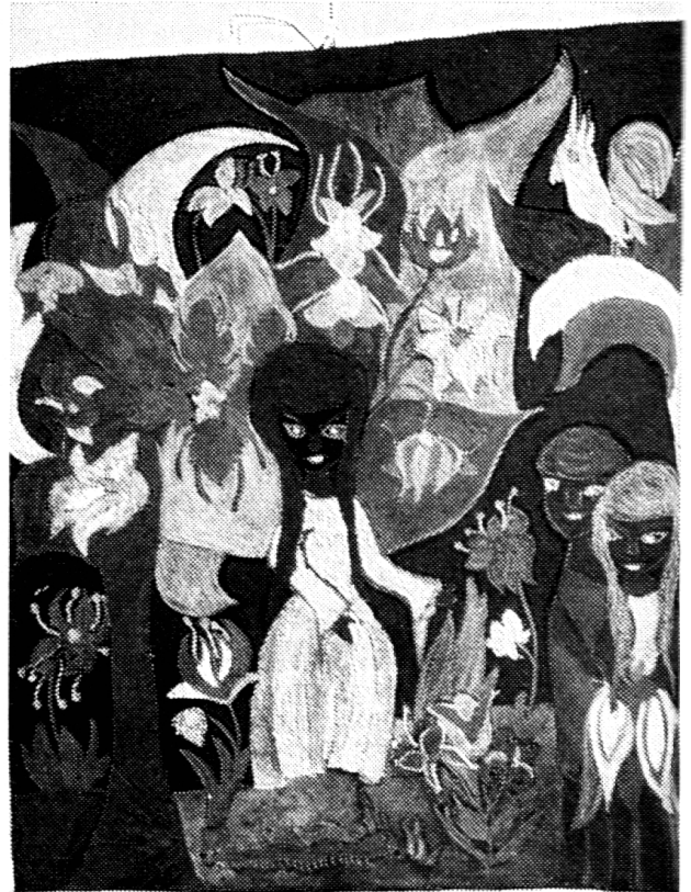
<Vertreibung aus dem Paradies>. Solche Bilder zaubert das Kind lächelnd hervor, so, wie es einen Schmetterling bewundert. Es bleibt ein Geheimnis.

* Vgl. auch <Das Herz der Kinder denkt tiefer als der Verstand der Erwachsenen> von Karl Stieger in <Schweizer Schule> 1959/60, S. 530 ff., 649 ff., 776 ff.