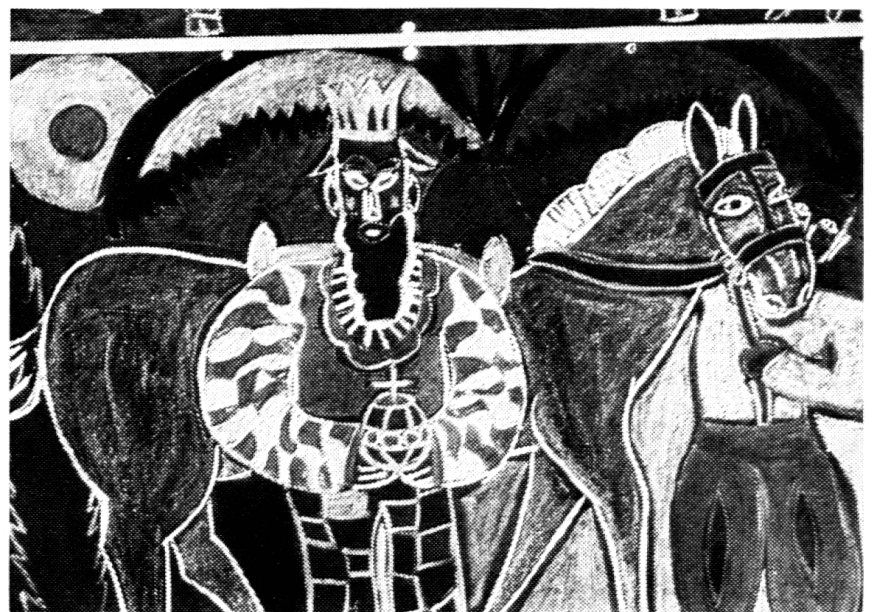
Wir Erzieher sind hier die Empfangenden, nicht die Gebenden. <Einer der drei Heiligen Könige schreitet zum Stall hin.>

täglichen Raschelatmosphäre. Stieger hat einen Weg. Wem der Grundsatz dieses neuen Weges im Geiste aufgegangen ist, der fühlt sich angerufen, selbst schöpferisch zu werden oder schöpferische Kräfte zu entdecken und zu entfalten. Das setzt den starken Glauben an die Kraft der Seele voraus. Stieger schreibt: «Das Schöne, das Wahre und das Gute