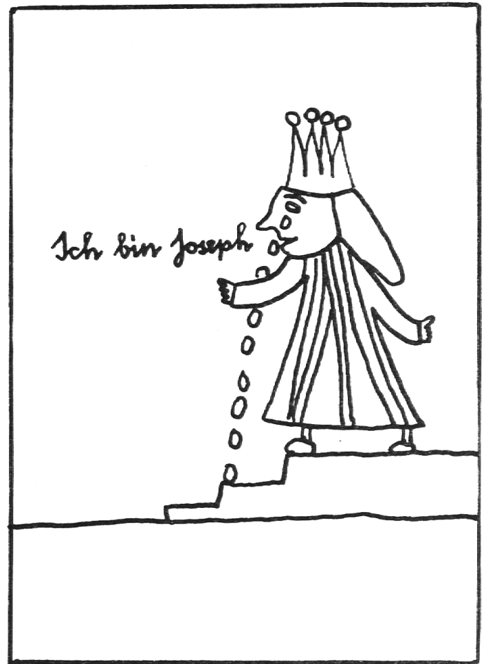
Joseph gibt sich seinen Brüdern zu erkennen

5. Am Ende des Jahres die Bibel binden lassen. Preis zirka Fr. 1.-.