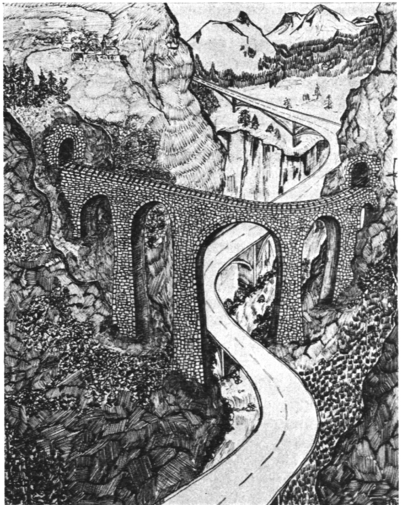
Knabe, 17 Jahre: Brücken