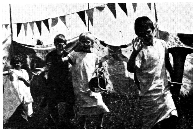
Auf Wiedersehen: ein ander mal wieder! (Im Vordergrund 2 Clowns)