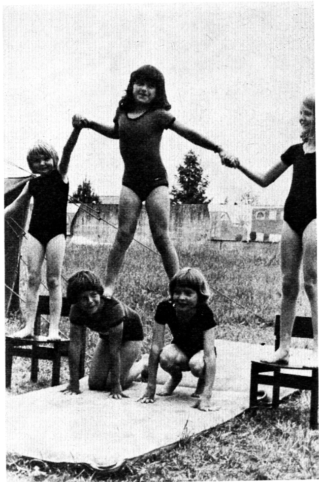
Die fünf komischen Akrobaten bei ihrem «perfektesten» Kunststück.