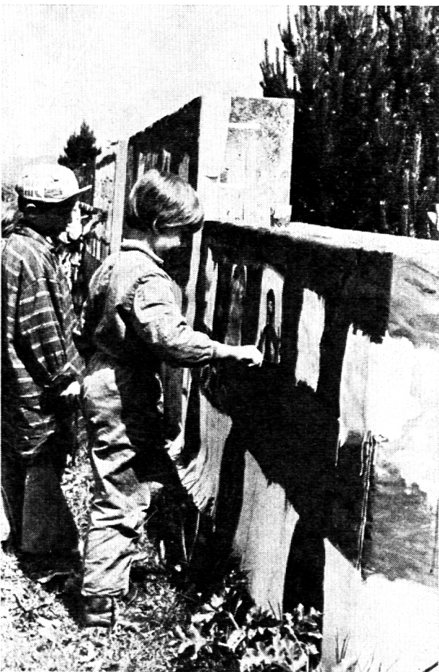
«Zirkuswagen» als Mauer-Attrappen