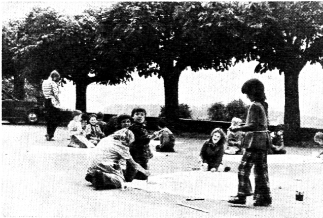
Bemalen der Leintücher