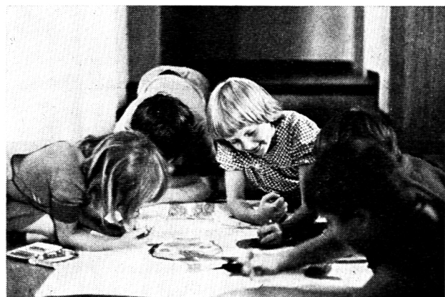
Kinder bei der Gruppenarbeit

Jede Gruppe gibt sich einen Namen und malt dazu ein passendes Gruppenbild. Zuteilung der Gruppenzimmer. Jede Gruppe geht von nun an in diesen ihr zugeteilten Raum.