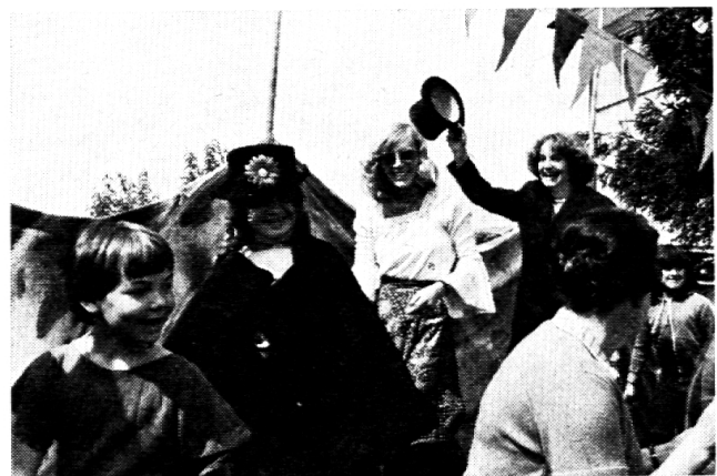
Auch unser Zirkusdirektor schwingt seinen Hut!