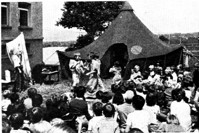
Die Clowns bei der Aufführung. Im Hintergrund: das Zirkuszelt.