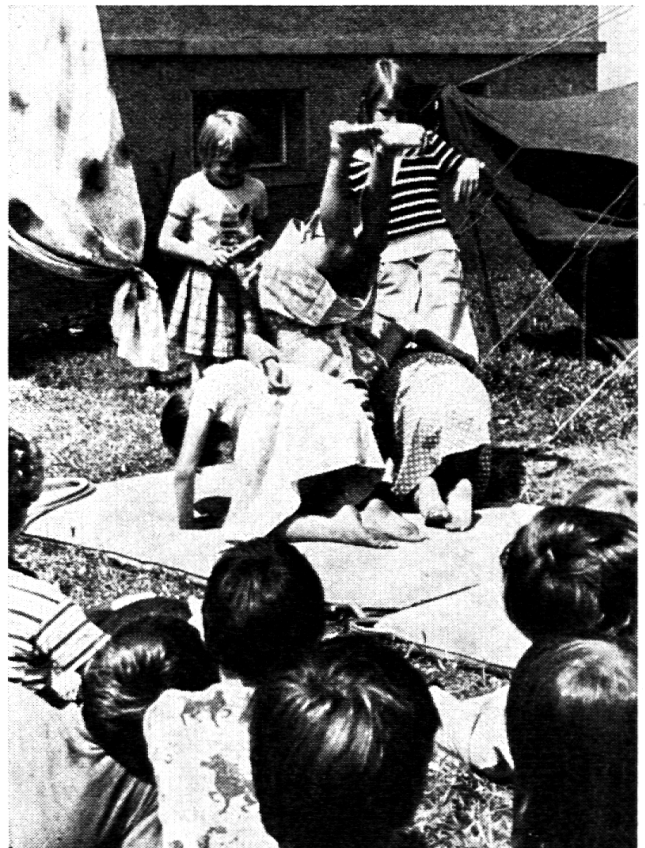
Die fünf komischen Akrobaten

de Gruppe ans Üben. Die Kinder entwickeln viele Ideen, und bald klappt dies und jenes Kunststück. Nach ca. dreiviertel Stunden spielt jede Gruppe den andern das bereits Geübte vor. Die andern geben Ideen zur Verbesserung weiter.