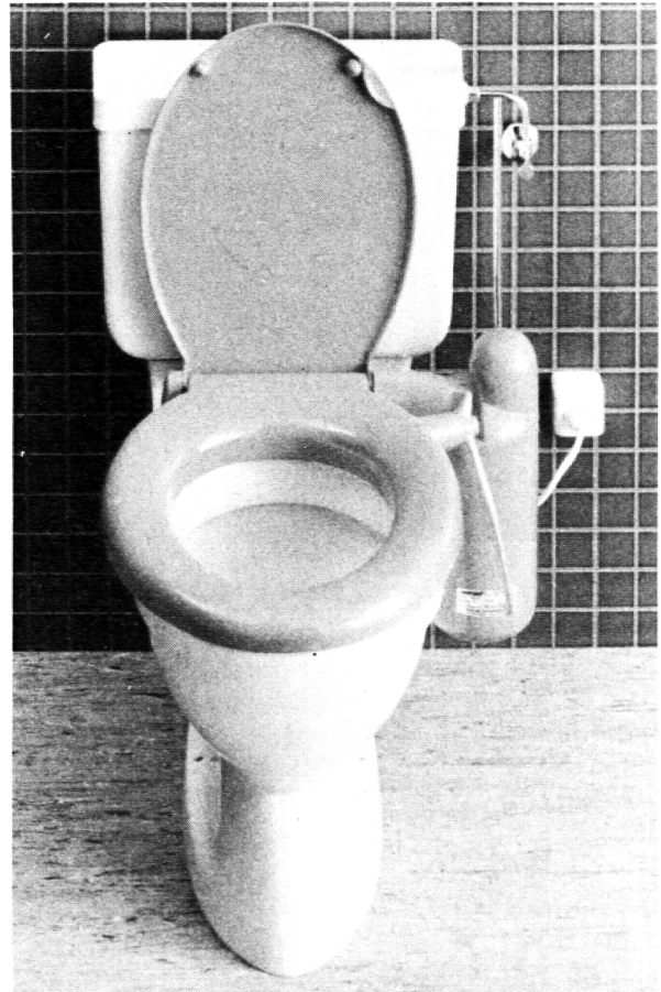
zu Bild: Düse nur zu Informationszwecken ausgeschwenkt gezeigt.

Wir geben Ihnen für 8 Tage zu unverbindlichem Versuch eine nigelnagelneue Sanett-WC-Dusche. Das Risiko einer durch uns ausgeführten Probemontage liegt nur darin, dass Sie auf den Apparat nach dem ersten Mal schon nicht mehr verzichten können. Ein gutes und lohnendes Risiko. Die elegante Reinigungsart mit warmem Wasser ist bereits seit Jahren tausende Male schon angewandt worden. Vor allem dort, wo sitzende oder stehende Berufe vorhanden sind. Aber auch anstelle des Papierwischens und in bezug auf Sauberkeit und angenehmes körperliches Befinden ist diese WC-Dusche unerlässlich. Ihre beste Investition auf Jahre hinaus.