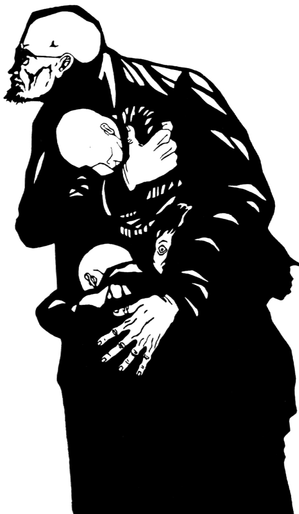
Die Nachtwache des Doktor Korczak, Holzschnitt von Bruce Carter (Kanada).

heutigen Tag» (IV, S. 17): Der Erzieher ist verantwortlich für die «nahe Perspektive» (Makarenko). «Das Ganze fügt sich aus Kleinigkeiten zusammen. Über die zerschlagene Scheibe und das zerrissene Handtuch, den schmerzenden Zahn, den erfrorenen Finger und das Gerstenkorn im Auge ... durch tausendfache Tränen, Unrecht und Schlägereien – durch das Gewirr von Bösem, Schuld und Fehlern – muss man sich durchkämpfen und sein heiteres Gemüt bewahren, um zu lindern, zu stillen, zu versöhnen und zu verzeihen, um das Lächeln gegenüber dem Leben und den Menschen nicht zu verlieren» (IV, S. 11).