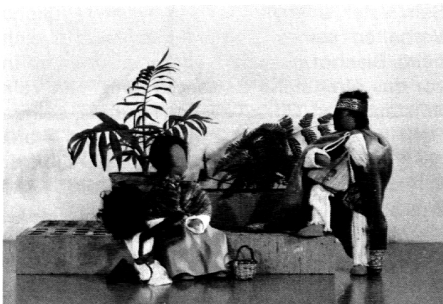
Bild 1: Der junge Franz half dem Vater im Geschäft. Gewandt, gütig zu den Armen, war er

Die folgende Bildreportage aus unserem Unterricht zeigt einige Szenen aus dem Leben des heiligen Franziskus. Die Schüler – 4. Primarklasse und 5./6. Hilfsklasse – waren hell begeistert von diesem neuen Unterrichtsmittel.