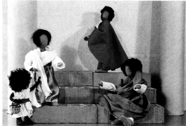
Bild 5: Seine Ratlosigkeit in der Suche nach dem neuen Lebenssinn veranlasste ihn, an den Apostelgräbern in Rom Hilfe und Klarheit zu suchen. Er pilgerte dorthin. Da erlebte er eine neue Enttäuschung. Scharen von Bettlern lagerten vor dem Petersdom. Die Kardinäle, die sich den Weg zum Portal bahnten, schauten verächtlich auf die Elendsgestalten. Keine Münze hatten sie übrig für dieses Gesindel. Wütend warf Franz seinen Geldbeutel hin, tauschte für einen Tag seine vornehme Klei-

dung mit einem Bettler, um am eigenen Leib das Los der Armen zu erfahren. In diesem Spiel erfuhr er, dass sein zukünftiger Lebensweg wohl etwas mit Armut zu tun haben musste.