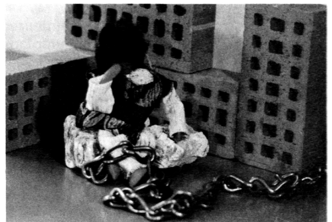
Bild 3: Es kam anders. Perugia besiegte die Nachbarstadt Assisi. Folge: lange Kerkerhaft für Franz und Krankheit, die die Ursache zu späteren Leiden wurde. Franz gab nicht auf,

Bild 2: Franzens Übermut kannte keine Grenzen. Der junge Mann träumte von Ritterehre und Heldentum. Günstig schien ihm die Gelegenheit, als zwischen Assisi und Perugia ein Streit ausbrach. Hoch zu Ross, in prunkvoller Rüstung, wollte Franz zeigen, wozu er geboren sei. Er glaubte, den Sieg schon in der Tasche zu haben und sah sich von allen geehrt und umjubelt.