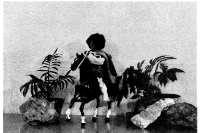
Bild 2: Franzens Übermut kannte keine Grenzen. Der junge Mann träumte von Ritterehre und Heldentum. Günstig schien ihm die Gelegenheit, als zwischen Assisi und Perugia ein Streit ausbrach. Hoch zu Ross, in prunkvoller Rüstung, wollte Franz zeigen, wozu er geboren sei. Er glaubte, den Sieg schon in der Tasche zu haben und sah sich von allen geehrt und umjubelt.

bei den Kunden beliebt. Mit geheimem Stolz beobachtete ihn sein Vater. Grosszügig unterstützte er seine Parties und er dachte an Geschäftserfolg und Reichtum, wenn Franz nächtelang singend und als Jugendkönig von Assisi verehrt durch die Gassen zog.