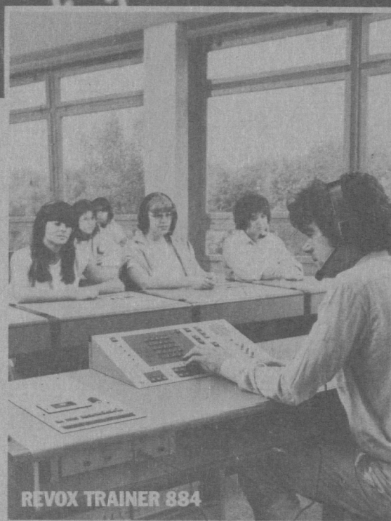
REVOX TRAINER 884

Umfangreiche technische Möglichkeiten und gleichzeitig funktionelle Klarheit der Bedienung waren bis anhin kontroverse Wünsche an eine AAC-Sprachlehranlage. REVOX hat das geändert. Mit hochentwickelter Computertechnik haben wir die Intelligenz der Steuerung dezentralisiert und so das Lehrerpult von unnötigem Ballast befreit.