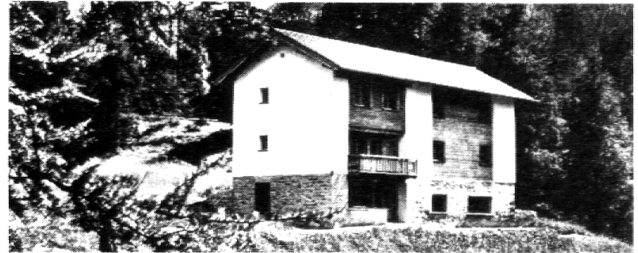
Ferienheim «Ramoschin» 7531 Tschier im Münstertal

Rund 20 Ferienheime an verschiedenen Orten.