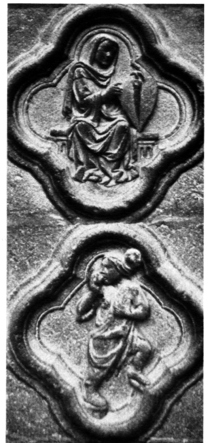
Klugheit und Torheit

Sie ist für mich eine wichtige Voraussetzung, um überhaupt fähig zu werden für die Versöhnung nach aussen. Wie oft erlebe ich mich und andere Menschen, wie wir mit uns und unserem Leben unzufrieden sind, keine echte, freie Freude am Leben haben, nur immer das Verpasste erkennen, die eigenen Wünsche und Bedürfnisse nie zu erfüllen versuchten, es aber immer als Manko spürten. Wenn ich mich mit meiner Situation nicht versöhnen kann, wie soll ich dann anderen,