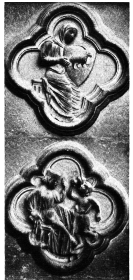
Sanftmut und Hartherzigkeit