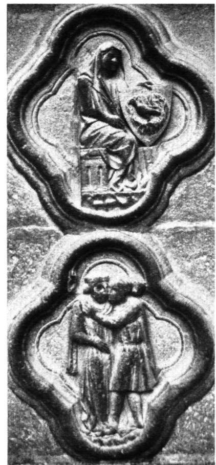
Keuschheit und Unkeuschheit

Um Zeiten des Abschiedes, des Loslassens, des Neuanfanges besser spüren zu können, nicht von den Aufbrüchen überrascht zu werden, braucht es eine neue Wahrnehmung in unserer Zeit. Capra sagt in seinem Buch «Wendezeit»: «Die Krise der Gesellschaft ist eine Krise der Wahrnehmung.» Wir Menschen hätten die Fähigkeit verloren, zu spüren, zu sehen und zu hören, wahrzunehmen, was wirklich mit uns und um uns herum geschieht, was wir als Menschen, was die gesamte Schöpfung braucht, was uns allen not tut, um in der Zukunft besser zu bestehen. Es zeigt sich hier das Problem der Überflutung durch Aktivitäten von aussen (Informationsflut,