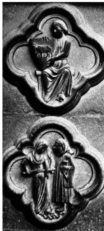
Geduld und Zorn

Erziehen heisst für uns, sei es in der Familie oder in der Schule, dass wir die Kinder befähigen wollen, die Probleme der Zukunft zu meistern. Aurelio Peccei, der Mitbegründer des Club of Rome, sagte im Bezug auf die fast nicht zu bewältigenden Probleme, die in der Zukunft auf uns zukommen: Wir sind dem Verderben nicht hilflos ausgeliefert. Was wir brauchen, ist eine Revolution der Menschlichkeit. Es geht darum, das grosse brachliegende Potential an Verstehen, Solidarität und Kreativität zu entdecken, das in jedem von uns steckt und die grösste Ressource der Menschheit darstellt. Für mich ist es eigentlich ganz