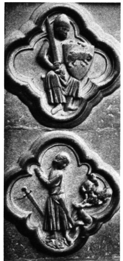
Tapferkeit und Feigheit

Ich glaube, dass es etwas ganz Selbstverständliches und Menschliches ist, wenn wir immer wieder (bewusst oder unbewusst) unsere Gedanken, Wünsche und Ideen, unsere Werte und Normen, all das, was wir für gut und wichtig halten, durch unsere Erziehung,