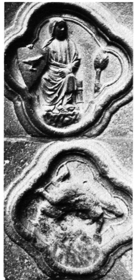
Demut und Stolz

Immer wichtiger wird aber für mich, dass wir die Notwendigkeit der Versöhnungsbereitschaft mit der gesamten Schöpfung erkennen. Als soziales Wesen bin ich in eine Gemeinschaft eingebunden und trage ich Verantwortung. Ich bin aber auch ein Teil der gesamten Schöpfung. Diese hat einen Anspruch darauf, dass es eine Übereinstimmung gibt zwischen dem, was ich tue, und dem Bedürfnis der Schöpfung. Dazu gehört auch der Anspruch des Überlebens. Als ein Mensch, der leben will, muss ich auch annehmen, dass andere Geschöpfe heute und in der Zukunft leben wollen. Das heisst, ich kann heute mein Leben nicht auf Kosten anderer Geschöpfe maximieren. Ich habe am Anfang die heutige