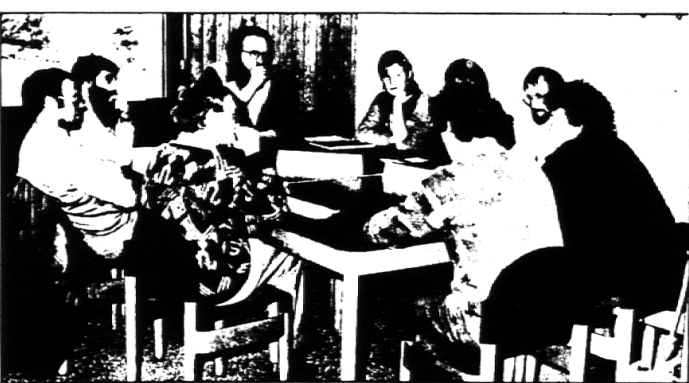
In Gruppen diskutierten gestern in Neuenkirch rund 80 Lehrerinnen und Lehrer das Thema «Schule ohne Noten» anlässlich einer Sono-Werkstatt des Primarlehrervereins des Kantons Luzern.

LUZERN/NEUENKIRCH – durch Gespräche zwischen Lehrer und Schüler und zwischen Lehrer