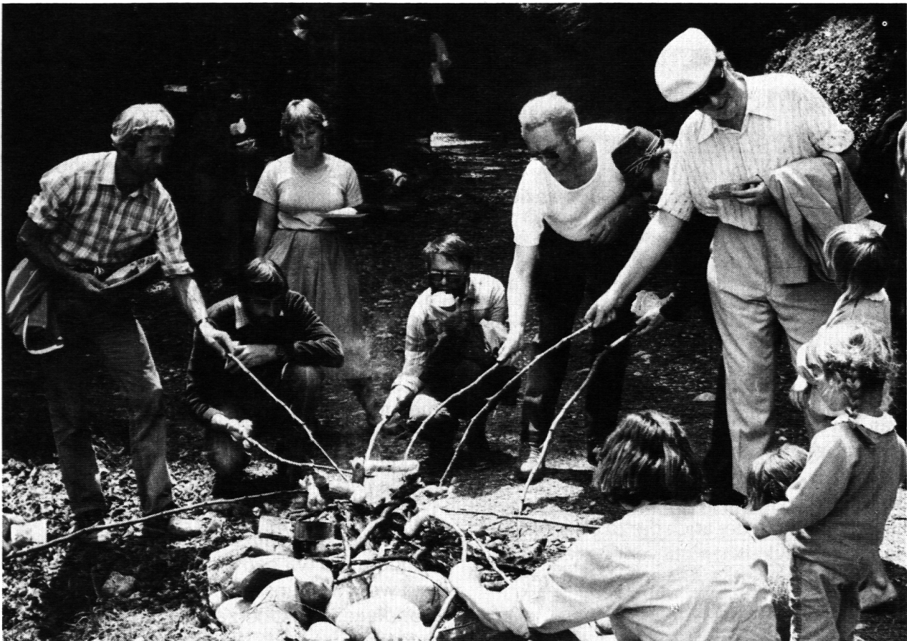
Auf dem Lehrerausflug

Leben trägt und bewegt. Die lange Zeit, die wir uns dafür einräumten, lohnte sich in vielfacher Hinsicht: es war in sich ein unüberhörbarer Aufruf zu Toleranz, ein Eingehen und Zugehen auf wirklich jeden einzelnen, ein Fundament-Legen für die weiteren Gespräche und die gemeinsame Arbeit, die dadurch bedeutend erleichtert wurde. Natürlich kam auch an den Tag, was wir nicht lösen konnten und was uns nicht befriedigte: einerseits spürten wir verständlicherweise neben dem Einigenden und Gemeinsamen auch das Trennende wieder stärker; und andererseits äusserten mehrere Kollegen das Unbehagen, im Schulalltag verändere sich trotz unserer intensiven persönlichen Begegnung und der folgenden Diskussion um Sachprobleme eben doch zu wenig: wir würden entgegen allen guten Einsichten und Vorsätzen den Alltagstrott nicht verlassen.