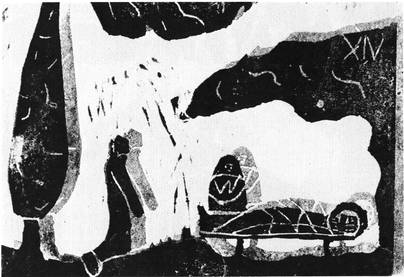
Vierzehnte Station: Jesus wird ins Grab gelegt

mindestens 20 Bilder verkaufen müsse. Das bedeutete, mehrere hundert Bilder zu drucken, was nur in der Freizeit geschehen konnte. Spontan stellten sich einige Buben für diese Arbeit zur Verfügung.