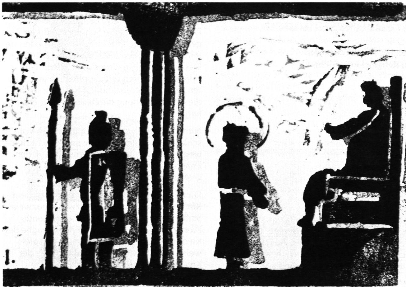
Erste Station: Jesus wird zum Tode verurteilt

den Schülern Vorstellungen vom Heiligen Land und den Heiligen Stätten zu vermitteln, zeigte ich entsprechende Dias, die ich anlässlich einer Heilig-Land-Reise gemacht hatte.