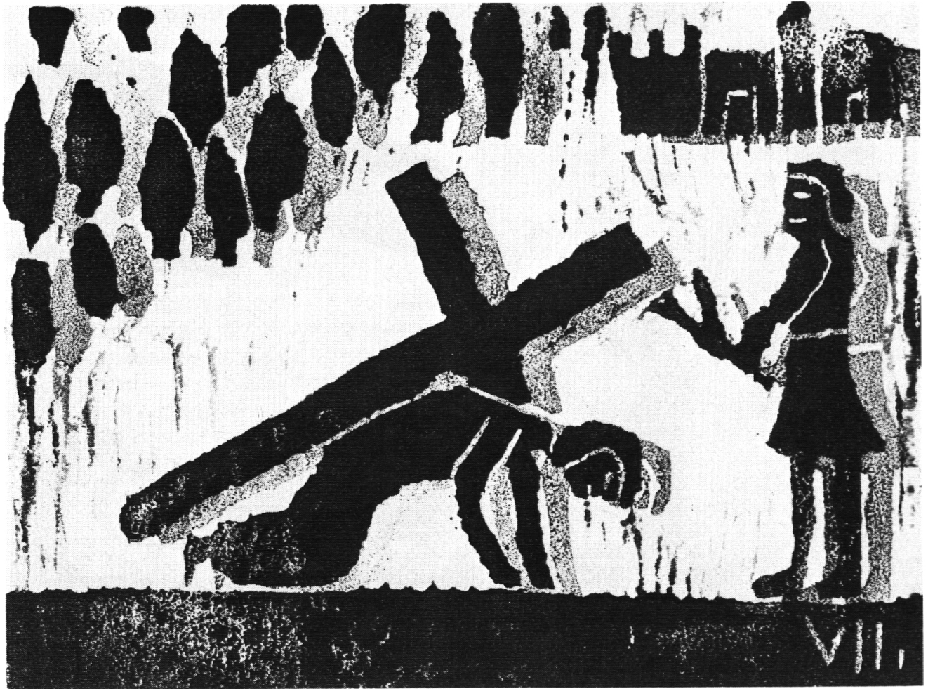
Siebente Station: Jesus fällt zum zweiten Mal unter dem Kreuz

gut gelungenen Arbeiten war bei gutem Willen etwas Positives zu vermerken. Negatives durfte nicht gesagt werden! Es war köstlich zu sehen, wie die Kinder, deren Arbeiten besprochen und gelobt wurden, reagierten.