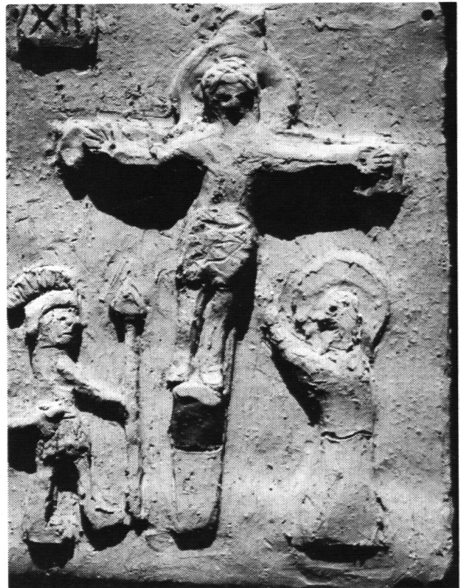
Zwölfte Station: Jesus stirbt am Kreuz

ein beglückendes Tun. Sie sind motiviert für eine Arbeit, wenn ihnen einsichtig ist, dass durch ihr Tun andern geholfen wird, dass etwas Gutes getan wird. Das Beherrschen bildnerischer Mittel und Techniken erhöht die Chance für Erfolgserlebnisse.