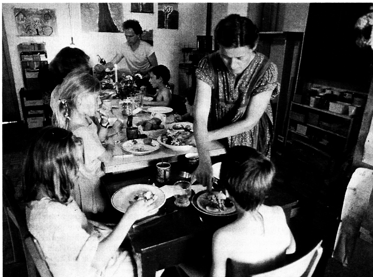
Freie Volksschule Nidwalden: Gemeinsames Mittagessen (Foto: Daniel Wiener, Basel).

1979. In Zürich wird von einigen wenigen Interessierten die Freie Orientierungs- und Mittelstufe (O+M) eröffnet. Die seit einem Jahr als Privatunterricht geführte Schule ist als Fortsetzung der nur die ersten 6 Schuljahre umfassenden zürcherischen Freien Volksschulen gedacht. Die O+M soll nach und nach zu einer schultypen-übergreifenden «Gesamt-