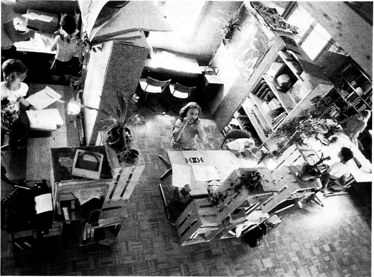
Freie Volksschule Nidwalden: Intime Arbeitsplätze.

auffassen. Sinnvoller scheint es mir, sie als Anpassung an die eigene, persönliche Realität, an die Realität der jeweiligen Schule und an die Realität einer veränderten gesellschaftlichen Grosswetterlage zu verstehen. Wenn viele der zu Beginn der 1970er Jahre gehegten Hoffnungen