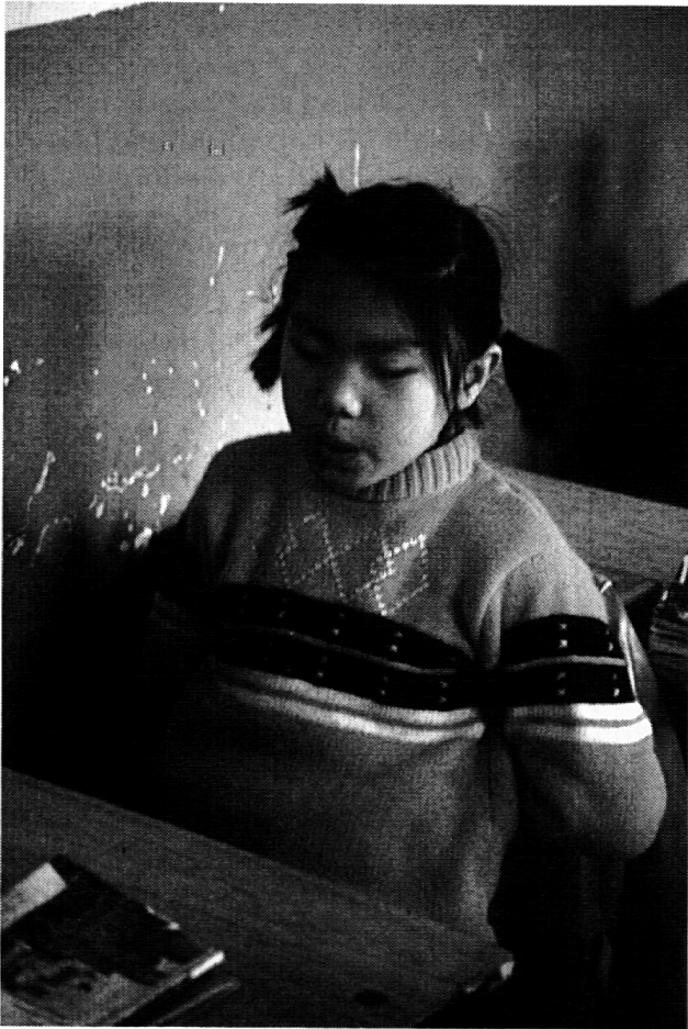
Auswendig wird der Stoff vor der ganzen Klasse repetiert.

von amerikanisierten Discoklängen und chinesischen Stücken Gymnastik betreiben. Eine 10-Uhr-Pause, wo die Kinder sich ungeordnet herumtollen, gibt es in China nicht. Die über Lautsprecher eingeflochtenen Kommandos erwecken für mich den Anschein von fast militärischer Disziplin und Ordnung, wie sie bei uns garantiert zu einem gemeinsamen Aufstand von Eltern und Schülern führten.