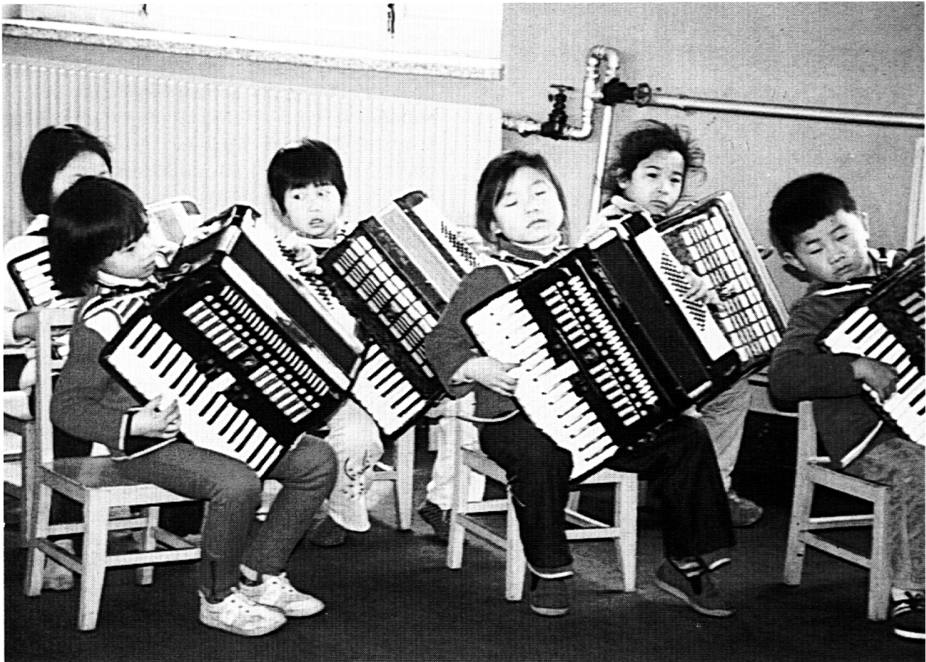
Touristen-Show der kleinen Virtuosen vom Kindergarten.