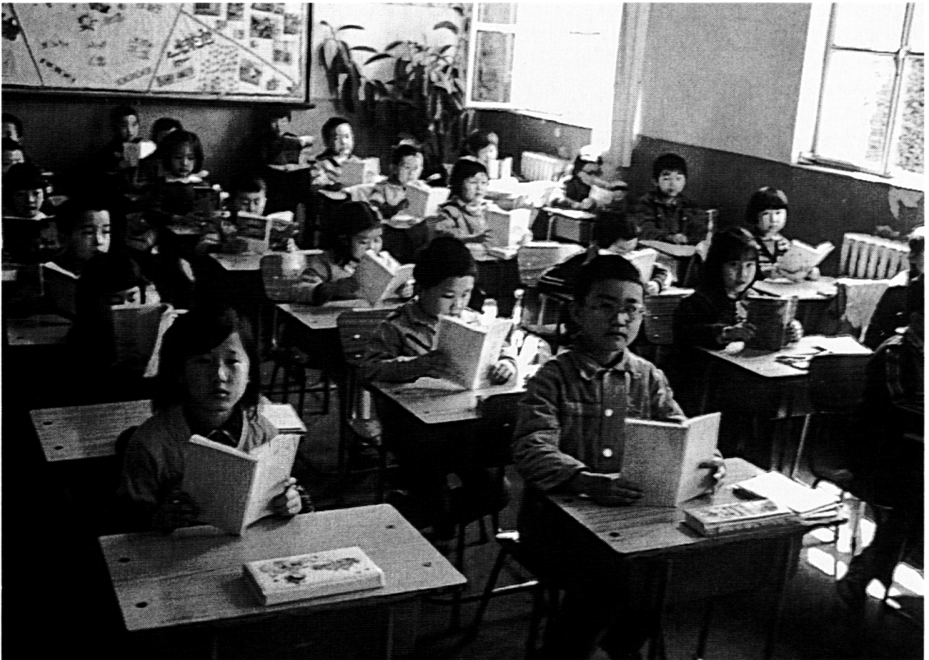
Disziplinierte Konzentration: Lesen aus dem Schulbuch.

etwas von der ursprünglich-magischen Kraft des Wortes, das nicht eine Sache abbilde, sondern die damit verbundenen Handlungszusammenhänge mitsetze. Das bedeutet aber auch für das Erlernen der Sprache und der Zeichen, dass der Schüler damit gleichzeitig in die Gesellschaft und ihre Normen und Verpflichtungen eingebunden wird. Mit anderen Worten: Sprachunterricht bedeutet weniger die Einübung in das Umgehen mit Abstraktionen und theoretischer Reflexion als die Übernahme eines stark symbolisch geprägten Handlungs- und Kommunikationssystems.