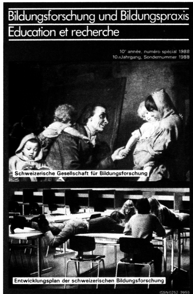
Schweizerische Gesellschaft für Bildungsforschung (Hrsg.): Entwicklungsplan der schweizerischen Bildungsforschung , in: Bildungsforschung und Bildungspraxis , 10. Jahrgang, Sondernummer 1988. 124 S., brosch., Fr. 20.–

Diese wirtschaftliche Herausforderung führt gleichzeitig auch zu einem steigenden Anteil der Ausgaben für die Forschung, die oft ebenfalls zum Prestigegewinn eines Staates dienen muss. Forschung aber setzt ein breites allgemeines Bildungsniveau voraus. Mit dem Eintritt in das Informatikzeitalter wird Bildung noch einmal an Bedeutung gewinnen. So bleibt jedem Staat nichts anderes übrig, «als eine Wirtschaftspolitik zu betreiben, in welche die Bildungspolitik an zentraler Stelle miteinbezogen ist. Damit gerät das Bildungswesen in allen Ländern in eine aufsteigende Spirale immer grösserer Investitionen in die allgemeine wie berufliche Grund und Weiterbildung, stetig neu angepasster Unterrichtsin-