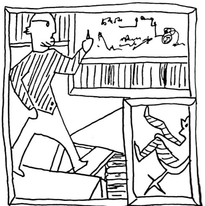
Die Rollen sind fixiert: Überverantwortlicher und Unterverantwortlicher.

3. Spielzug : Je nachdem wie rasch ich mich erhole, wechsele ich aus der «Opfer»-Rolle in die «Verfolger»-Rolle: ich drohe den Schülern mit Proben und mit Rückversetzungen, mit Zuwendungs-Entzug und mit Strafen. Die Schüler reagieren mit Angst und wechseln von «Rettern» zu «Opfern».