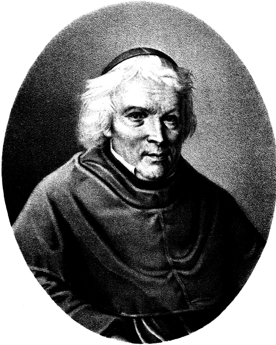
Père Grégoire Girard (1765–1850), der «Westschweizer Pestalozzi».

den Dienst der Inneren Differenzierung. (Vgl. «Aus der Schulgeschichte der Schweiz», Nr.6)