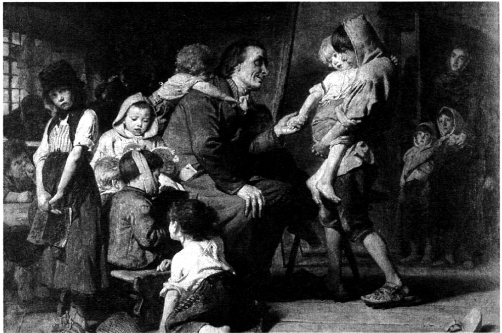
Bilder helfen mit, einen Mythos zu formen. K. Grob (1879): Pestalozzi in Stans