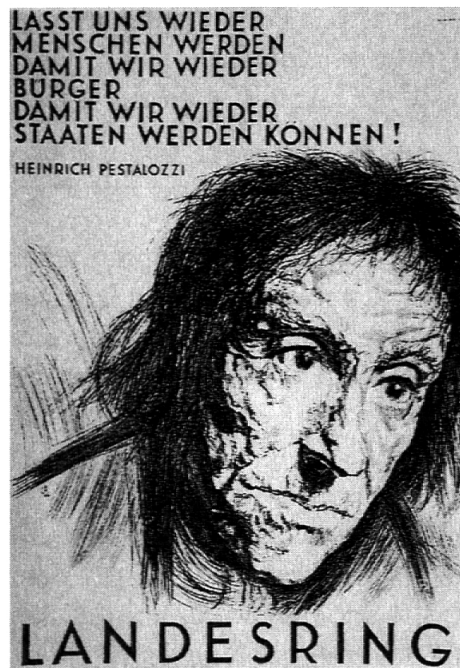
Politische Vereinnahmung Pestalozzis. Werbeplakat 1964, von Otto Baumberger