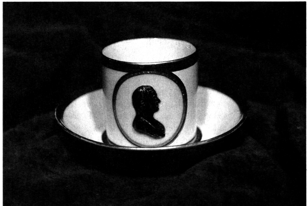
Zeichen der Verehrung: Pestalozzi aus Porzellan.