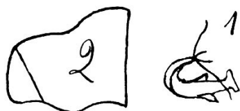
Fig. 1: Pénis \times 75 , vue dorso-rétro-latérale droite. (Remarquer les petites expansions latérales triangulaires vers la base, lesquelles n'ont pas été signalées dans la description.) Fig. 2: Lobe droit du pygophore ♂ \times 40 , vue latérale.