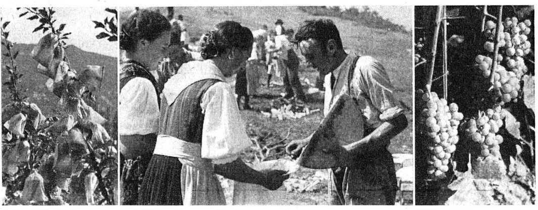
Schutz hochwertiger Aepfel vor Schorf etc. La Sarvaz