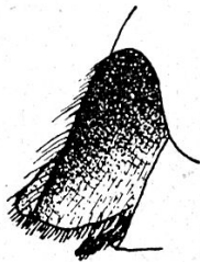
Fig. 1. — Pompilus opinatus Tourn. ♂, plaque génitale.

♀. 9-11 mm. Les trois premiers segments rouges, le premier avec une tache noire à la base, le troisième plus ou moins obscurci à l'extrémité, mais jamais franchement noir. Bord antérieur du clypéus un peu échancré, comme chez unguicularis , pas nettement rebordé au milieu; partie inférieure du clypéus brillante, avec des points espacés; cette zone brillante est plus large que chez les espèces voisines. Deuxième article du funicule aussi long que le scape et le pédicelle réunis. Front demi-mat montrant, vu de profil, des