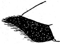
Fig. 3. — Pompilus nudus Tourn. ♂, plaque génitale.

P. nudus est très voisin d' alpivagus et pourrait presque être considéré comme sous-espèce de ce dernier ; il s'en distingue cependant par sa taille plus grande, la pilosité plus développée (front et propodéum), les ailes enfumées, la troisième cellule cubitale plus large, la ♀, de plus par les articles du funicule plus longs (le deuxième article du funicule, chez alpivagus , est deux fois et demie plus long que